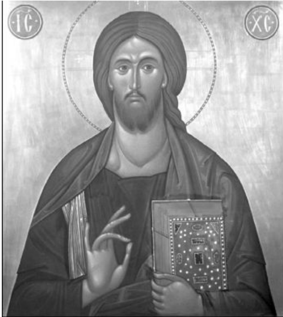
Икона «Спас Вседержитель»