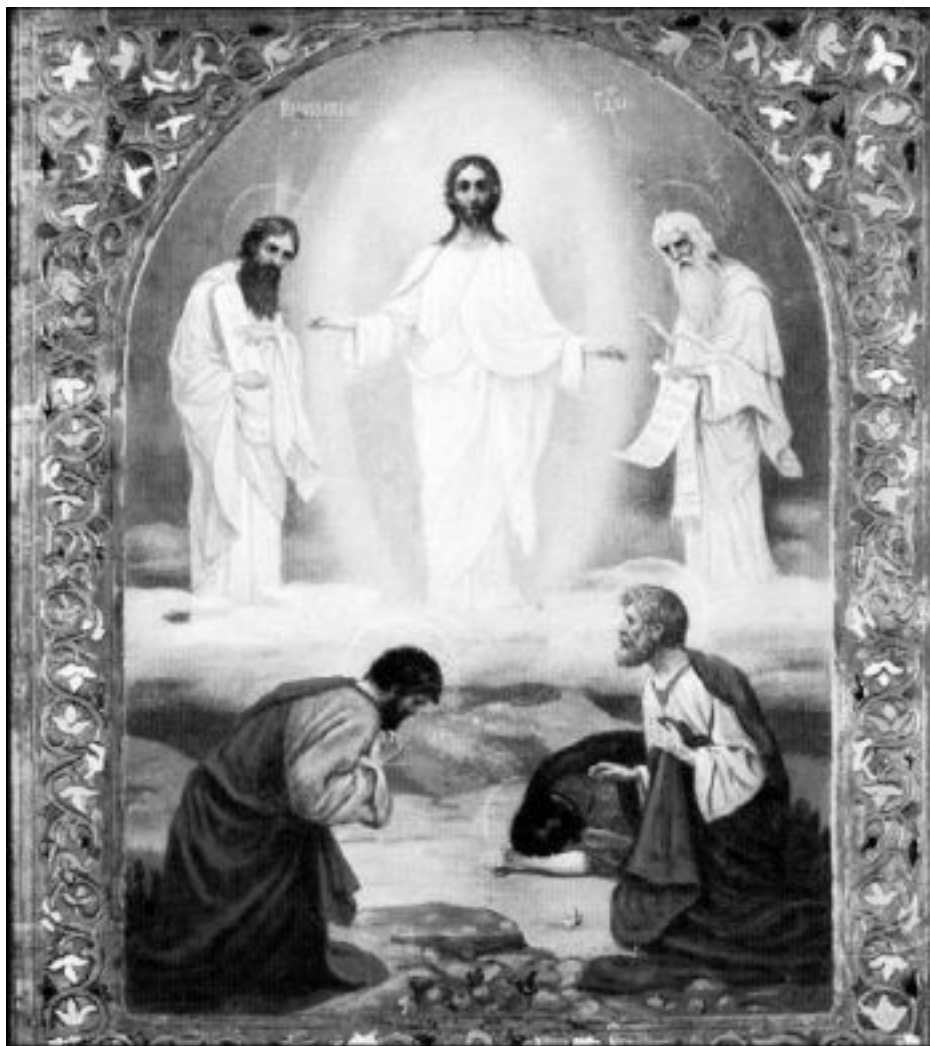
Икона «Преображение Господне»