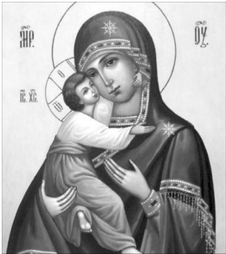
Икона Пресвятой Богородицы «Владимирская»