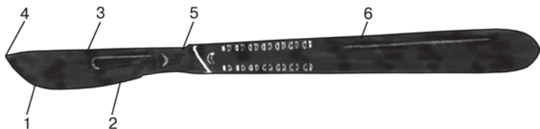
Рис. 2. Особенности конструкции хирургического ножа (объяснение в тексте) (по: Medicon Instruments, 1986 [7]).

Указанные составляющие находятся в разных соотношениях, определяющих вид хирургического ножа и его предназначение.