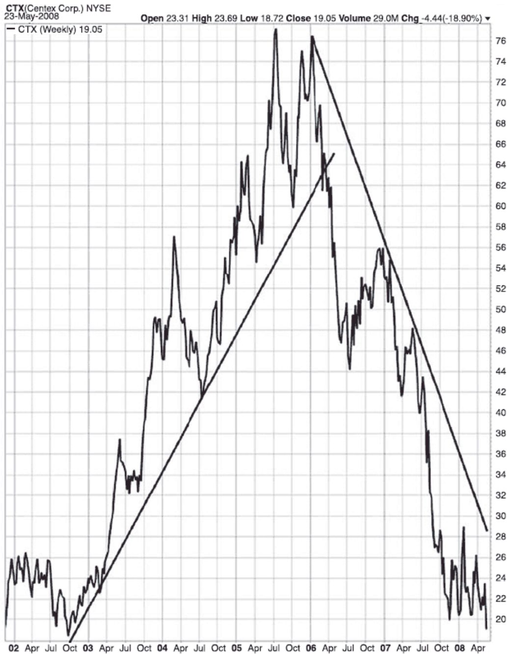
Рис. 1.2. Этот график демонстрирует восходящий и нисходящий тренд одной акции. После утробения цены в 2003–2005 гг. акция домостроительной компании опустилась за два года почти на столько же. Очень важно видеть различия между этими двумя трендами.