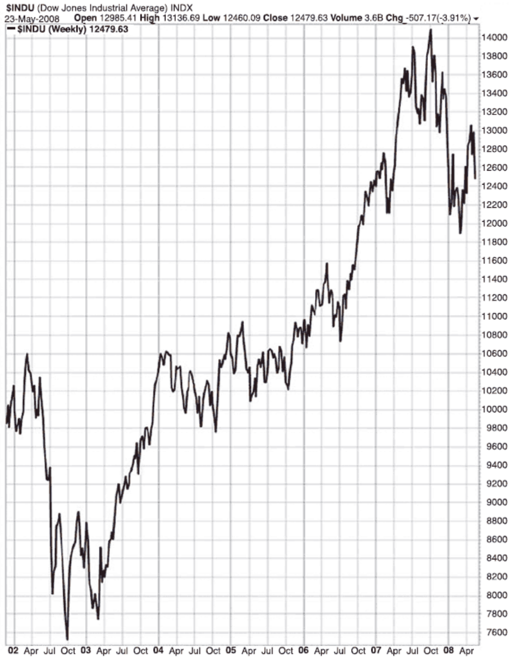
Рис. 1.1. Любому, кто не верит в направленное движение рынков, стоит взглянуть на этот график индекса DJIA (символ $INDU). Инвесторы, которые разглядели этот четырехлетний восходящий тренд и поверили в него, заработали немало денег в 2003–2007 гг.