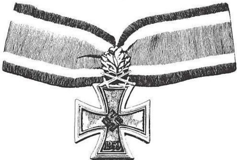
Рис. 1. Рыцарский крест с дубовыми листьями

Все, находящиеся в Бад-Цвишенане, приехали из разных мест: с русского фронта, из Франции, Африки, Италии или Финляндии. Каждый человек был личностью, индивидуальностью; по характеру ребята отличались друг от друга кардинально, но одно объединяло всех – общий язык и страсть к полетам. Несмотря на бесчисленное количество мнений, мы являлись одной «связкой». Следующие за этим днем долгие месяцы наша жизнь порой была невыносимо трудна, но это