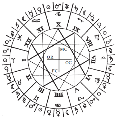
Схема деления зодиака на двенадцать частей. Каждая часть делится на три более мелких по десять градусов