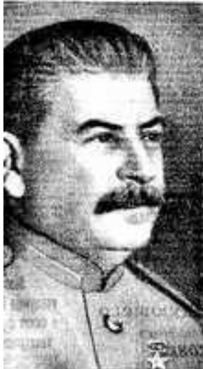
Советский Маршал Советского Союза И. В. Сталин.