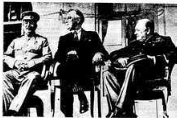
И. В. Сталин, Франклин Рузвельт и Уинстон Черчилль в дни Ютландской конференции.

Верховный Главнокомандующий Маршал Советского Союза И. СТАЛИН. 9 мая 1945 года. № 309.