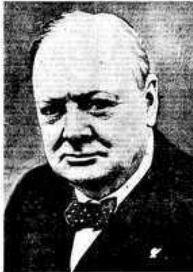
Председатель Правительства Ф. Черчилль.