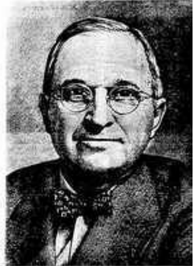
Президент США Ф. Рузвельт.