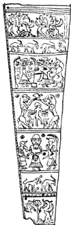
Рис. 5. Колчан с рельефом. Кух-и-Дашт. Метрополитен-музей, Нью-Йорк. Высота – 21 дюйм.

Как свидетельствуют дошедшие до нас немногочисленные