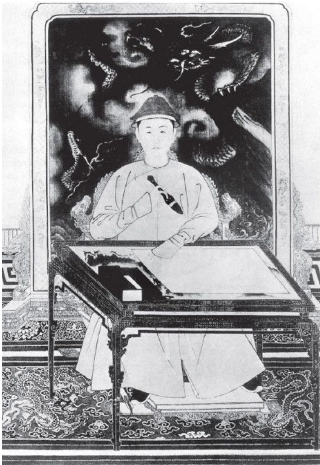
Используя кисть, подобную той, что изображена на рисунке, знаменитый император династии Цин Канси пишет, сидя за столом напротив картины с изображением дракона