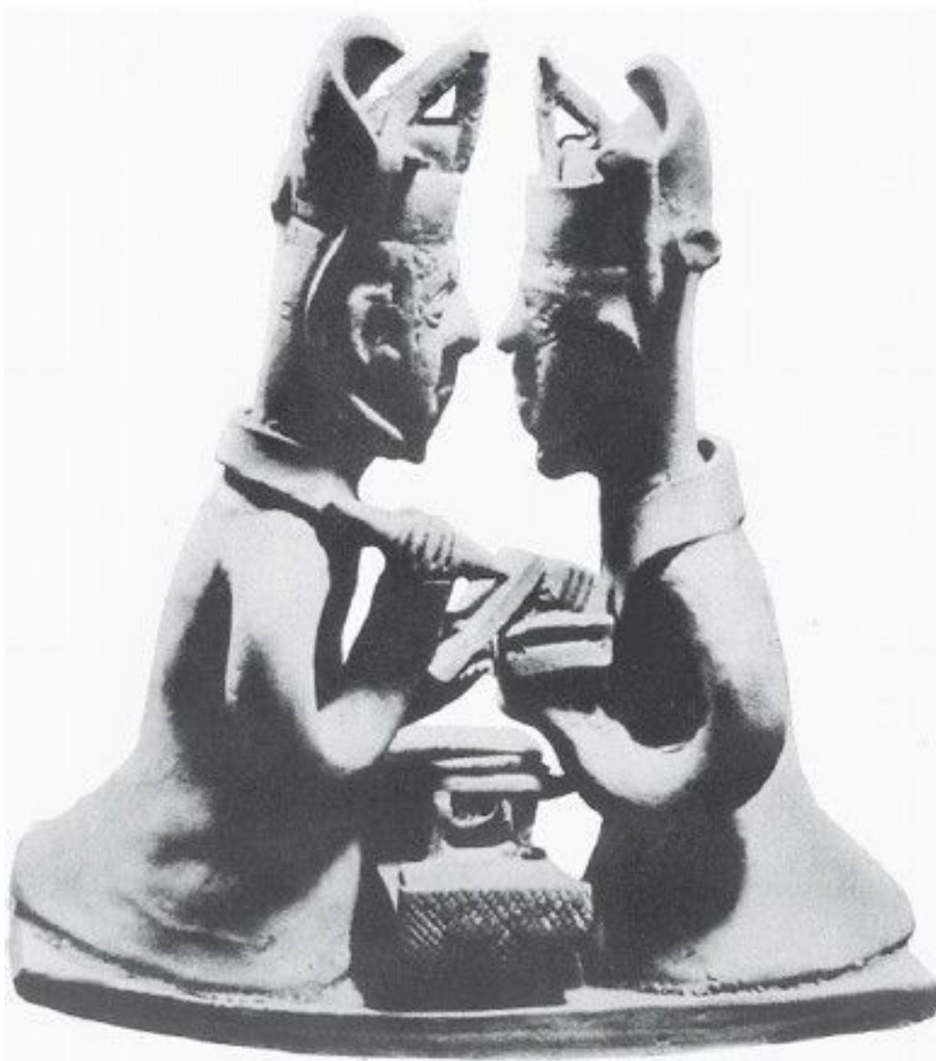
Фаянсовая скульптура периода династии Цин изображает двух писцов с принадлежностями для письма

Китайцы пришли к пониманию, что буквенная система могла бы оказаться полезной для ускоренного изучения иероглифов и служить инструментом в борьбе с безграмотностью. До изобретения этой системы китайцы испытывали трудности в чтении иностранных слов и имен, поскольку их передача с помощью иероглифов была неэффективной. Некоторые иностранные имена, такие, как Ли или Ханн, легко передаются с помощью иероглифов. Другие, такие, как Рузвельт или Рассел, невозможно точно передать с помощью иероглифов. В китайском нет начальной «р» или «л» (ну и многих других букв тоже). В китайских документах эти имена приобретали вид «Ло Сыфу» или «Ло Сы». И естественно, читателю надо было приложить немало усилий для того, чтобы понять значение этих слов. Комиссия еще в 1956 году решила, что не стоит рекомендовать использование кириллицы для передачи китайских слов и что предпочтительнее использовать латинский алфавит «как наиболее распространенный». Затем члены комиссии решили, что система романизации предпочтительнее, чем система Уэйда–Джайлза (и ее производные) или французская система. Она поможет избежать использования