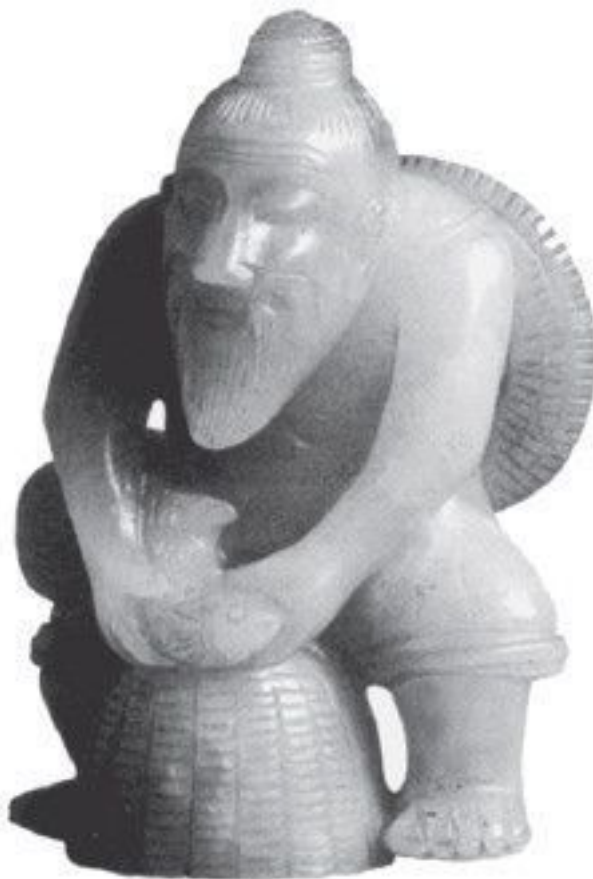
Склонившийся над сетью рыбак времен династии Мин, вырезанный из черного нефрита, рассматривает улов

много общих черт с расширением китайских владений за морем – в Малайзии, Индонезии, Таиланде, Бирме и на Филиппинах. Установлено, что в Малайзии и Сингапуре поселились многочисленные повстанцы-тайпины, которые бежали из Китая после поражения восстания в середине XIX века. Постепенное расселение китайцев на южных землях продолжалось более двух тысяч лет. Было бы неверно при этом делать вывод о том, что тому препятствовала внешне-неполитическая ситуация. Нет ничего особенно нового в том, как нынешнее правительство Китая стимулирует и поощряет заселение Синьцзяна и Тибета. Точно так же действовали все сильные правящие династии, начиная со времени династии Хань, – они стремились расселить свое избыточное население в пограничных районах, чтобы укрепить власть центра над отдаленными провинциями.