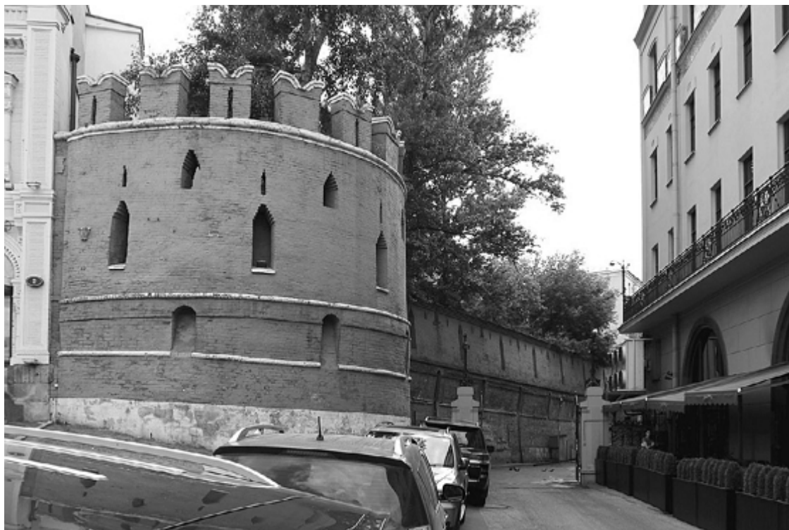
Фрагмент Китайгородской стены

Ну а треугольник, вписанный в круг, на языке символов означает «жизнь, вписанную в вечность». Более того – жизнь земную (треугольная твердь), входящую в вечность (небесный круг). Еще этот символ прочитывается так: треугольник – живая человеческая энергия, уходящая в просторы космоса-круга. Ну а с точки зрения символа времени это означает, что поток вечного времени (круг) всегда будет иметь свободный вход в земное существование данной территории (треугольник). То есть город, выстроенный в подобном плане, всегда будет иметь свои порталы времен. И время станет выходить здесь на поверхность хоть из космической истории, хоть из земной. Вот откуда встречи людей различных времен, о которых рассказывал тот же Суриков. И заметьте, это не призраки или привидения. Это смещение времен, происходящее таким способом, что все участники временного события чувствуют себя реально живыми. Не потому ли и встреченные Суриковым бабы в старинных одеждах пугались его так же, как и он их?