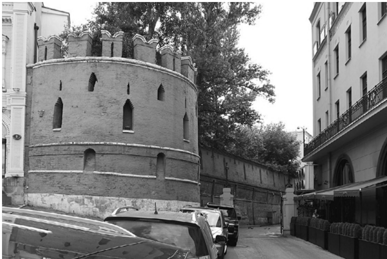
Фрагмент Китайгородской стены

Ну а треугольник, вписанный в круг, на языке символов означает «жизнь, вписанную в вечность». Более того – жизнь земную (треугольная твердь), входящую в вечность (небесный круг). Еще этот символ прочитывается так: треугольник – живая человеческая энергия, уходящая в просторы космоса-круга. Ну а с точки зрения символа времени это означает, что поток вечного времени (круг) всегда будет иметь свободный вход в земное существование данной территории (треугольник). То есть город, выстроенный в подобном плане, всегда будет иметь свои порталы времен. И время станет выходить здесь на поверхность хоть из космической ис-