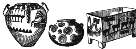
Рис. 7. Глиняные горшки и ящик 4-го тысячелетия до н. э.

На рис. 5 – 7 изображены предметы, которые древние египтяне доисторического и додинастического периода использовали в повседневной жизни. В частности, здесь показаны образцы прекрасно заточенных ножей, которыми они пользовались во время обрядов жертвоприношения; причудливо разрисованная глиняная посуда самых различных видов и стилей; изящные кувшины и вазы, сделанные из самых разных камней; личные украшения и оружие.