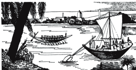
Рис. 2. Величайшая артерия Египта – река Нил

«Слава тебе, о Нил, берущий свое начало в земле, чтобы накормить Египет. Хвала тебе, о Нил! О ты, который привел человека и его стадо, жить на этих лугах! Хвала тебе, о Нил!»