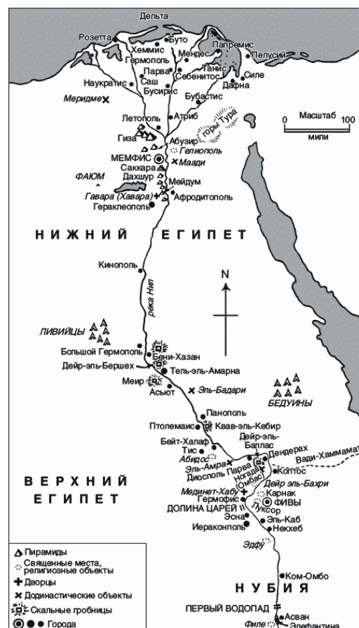
Рис 1. Карта Древнего Египта

Древние египтяне были страстными садоводами и опытными ботаниками, поэтому нет ничего удивительного в том, что земля, на которой они жили, должна была напоминать цветок, который они больше всего любили изображать на своих памятниках, – лотос.