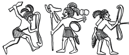
Рис. 4. Охотники додинастического периода

Крестьяне додинастической эпохи, которые жили в поселениях Верхнего и Нижнего Египта, постепенно достигли очень высокого уровня развития. Они были умными, изобретательными людьми, которые, собственно, и заложили основу будущего процветающего египетского государства (рис. 4).