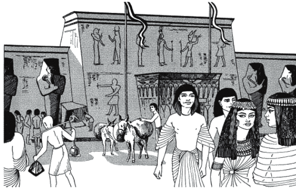
Рис. 8. Сценка из уличной жизни Тель-эль-Амарны

Главные здания были похожи на гордые островки, возникшие посреди шумного океана менее претензионных собратьев. Конечно, более зажиточные члены общества жили в просторных пригородах, как это происходит и в современных городах; однако ничем не сдерживаемый поток простых граждан проникал в города и стремился «зацепиться» за любой пригодный для жилья уголок. Так и получилось, что импозантные стены усыпальниц знати терялись среди неопрятных сараюшек и бараков, которые лепились к ним, как утлые лодочки стремятся держаться поближе к красавцу лайнеру. Время от времени какой-нибудь фараон или высший жрец начинал кампанию по «очищению» святых мест, и посягнувшие на чистоту святынь выдворялись с обжитых мест. Однако эти победы чаще всего были временными. Как только страна вступала в новый период анархии или плохого управления, замученные жизнью люди вновь начинали устраивать себе жилища вокруг центральных зданий. Им это подсказывал здравый смысл. В обычных обстоятельствах городские ворота не запирались ни днем ни ночью, однако в чрезвычайных ситуациях люди чувствовали себя спокойнее, зная, что рядом – надежные городские стены. Дворец или храм были осью, вокруг которой вращалась торговая жизнь города, поэтому разумнее было держаться поближе к основному источнику процветания и защиты.