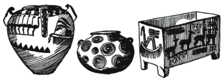
Рис. 7. Глиняные горшки и ящик 4-го тысячелетия до н. э.

На рис. 5 – 7 изображены предметы, которые древние египтяне доисторического и додинастического периода использовали в повседневной жизни. В частности, здесь показаны образцы прекрасно заточенных ножей, которыми они пользовались во время обрядов жертвоприношения; причудливо разрисованная глиняная посуда самых различных видов и стилей; изящные кувшины и вазы, сделанные из самых разных камней; личные украшения и оружие.