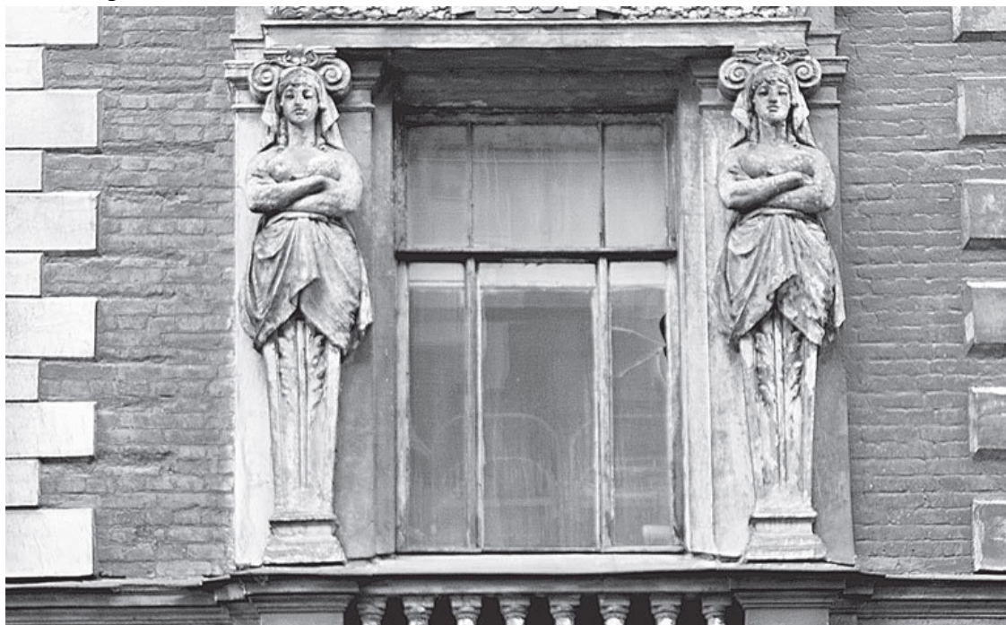
Английский пр., 4

Кора не просто девушка – это одно из поименований древнегреческой богини Персефоны (Персефонеи, Персифассы, Персефатты или в римской мифологии Прозерпины), владычицы преисподней и, что еще важнее, одновременно богини произрастания злаков и всего земного плодородия. Культ богини преисподней существовал в Пилосе еще в микенскую эпоху. Невозможность объяснить имя Персефоны, исходя из греческого языка, заставляет предполагать, что она являлась древней местной богиней, культ которой был распространен до вторжения греков – доритов на Балканский полуостров (примерно 1500 лет до Р. Х. – Б. А.). У завоевателей культ Персефоны сливается с культом богини-девы Кору. Кора почиталась как богиня плодородия и, возможно, первоначально отождествлялась с богиней-матерью Деметрой. Дальнейшее развитие греческой религии превращает Персефону-Кору в дочь Деметры, но общность культа этих богинь сохраняется на протяжении всей греческой истории. Они всегда либо вместе, либо рядом.