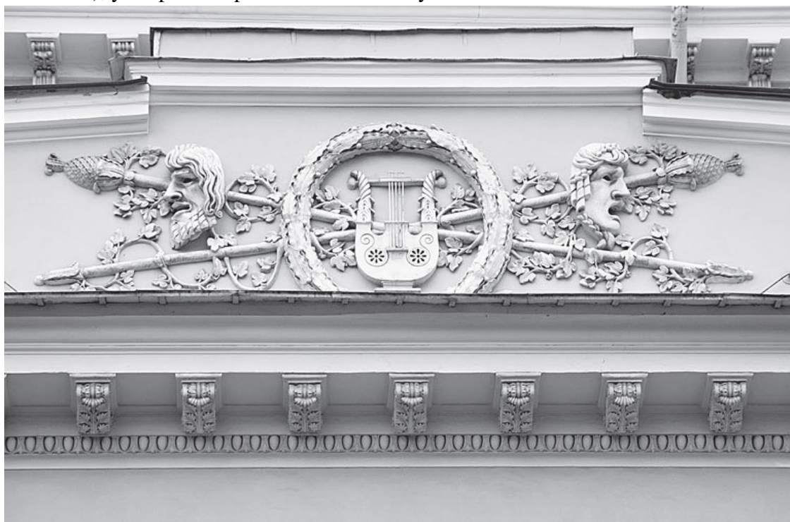
Пл. Островского, 2

Атрибут ( лат. attributum – наделяю) – принадлежность, свойство, существенный признак; в логике атрибутом называется нераздельное от предмета свойство, без которого понятие о нем изменяется. «В искусстве атрибутом называется символическая принадлежность, свойственная какому-либо лицу, преимущественно внешний предмет, значение которого улавливается даже неопытным глазом. Тогда как образованному зрителю для различения Зевса от Гермеса достаточно обратить внимание на характеристическое выражение лиц, формы тела и т. п., большинство различает их по атрибутам: у первого – перун (перун – в данном случае пучок молний), у второго – крылатый жезл – кадуцей 19 ».