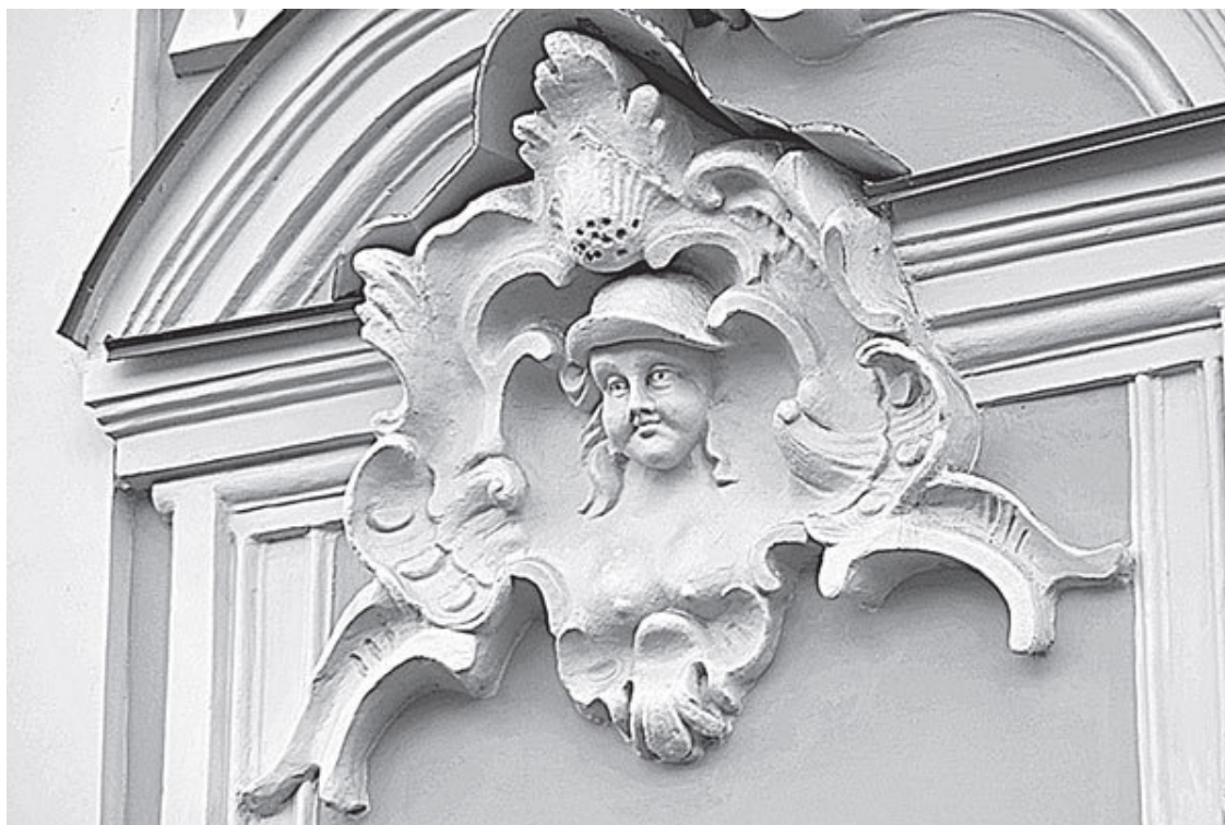
Невский пр., 17

«Декоративные элементы и, в частности, львиные и человеческие маскароны на фасадах зданий классического стиля впервые увидели петербуржцы в конце 60-х годов XVIII века. Это были обывательские дома, возведенные по проекту современника И.Е. Старова архитектора А.В. Квасова, участвовавшего в разработке генерального плана реконструкции Петербурга. Один из них – дом № 8 по Невскому проспекту (дом Сафонова) сохранился до наших дней. Замковые камни окон его первого этажа украшены женскими масками. В конце XVIII – начале XIX века на фасадах жилых домов женские маски стали появляться повсеместно: дом Брюллова (В.О., Съездовская линия, 21); дом Петровых (наб. р. Фонтанки, 92); дом Дехтерева (Спасский пер., 11), авторы построек не установлены; жилой дом Академии наук (наб. Лейтенанта Шмидта, 1), построен учеником А.Н. Воронихина Д. Филипповым в 1806–1808 гг. и перестроен по проекту архитектора А.Д. Захарова его помощником А.Г. Бежановым в 1808–1809 гг.