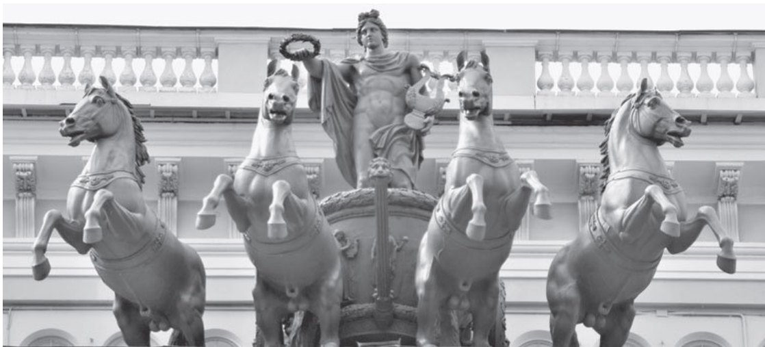
Пл. Островского, 2

Словарь сообщает далее, что курорсы трактуются «в настоящее время преимущественно, как изображение юноши, однако, скорее всего, представляет собой изображение мужской фигуры вообще». Это наши выводы не опровергает. Тем более, достаточно взглянуть на лица, скажем, курорса у Эрмитажа и Аполлона Бельведерского, чтобы убедиться в сходстве. Грубо говоря – у Эрмитажа курорс Аполлон работает атлантом! И то сказать, что титану Атланту делать у Нового Эрмитажа, который строился как первый в России художественный музей?