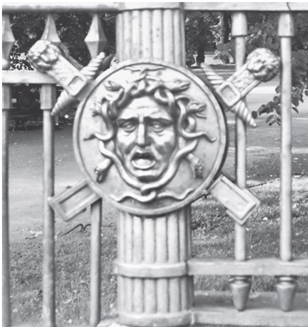
Летний сад. Решетка Шарлеманя

Отпугивающее изображение головы горгоны Медузы без щита называется горгулий . Кстати, во времена архаики греки представляли себе Горгону совсем не так, как она выглядит в позднейшей традиции.