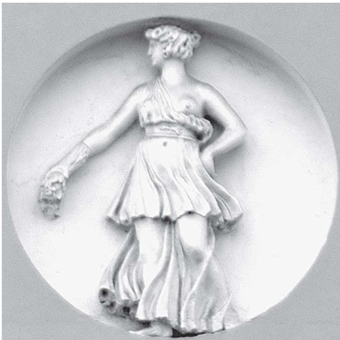
Наб. р. Мойки, 23