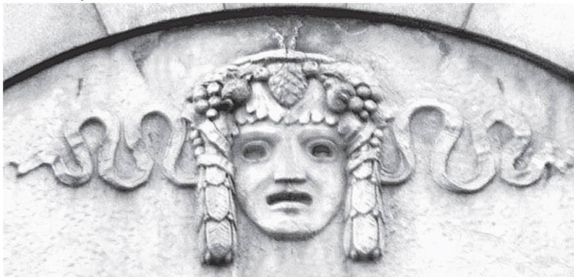
Садовая ул., 34

Отгадка найдена совсем недавно. Помогли странные орнаменты – цепочки, сопровождавшие рисунки, сопутствующие, кстати, почти всем первобытным рисункам и существующие до сегодняшнего дня в традиционной культуре бушменов. Психиатры, изучившие эти странные цепочки, пришли к единодушному мнению: их «видит» человек, входя в состояние транса. Стало быть, животные на рисунках – это то, что «видел» жрец или шаман, впадая в священное, ритуальное, «потустороннее» сознание. Он создавал свои фрески с колдовскими или, возможно, с «познавательными» целями, что было в ту пору, вероятно, одно и то же, а древнейшая живопись – не художественная самоцель.