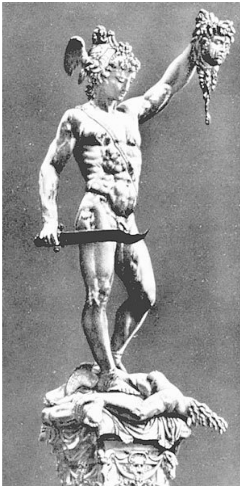
Б. Челлини. Персей с головой Горгоны. Флоренция. XVI в.

Антропоморфные маски – человеческие лица, наследие древней европейской цивилизации, но кроме них дома оберегают бесчисленные львы, грифоны, химеры, а еще чаще всевозможные орнаменты – тоже изначально обереги. Они – прямые родственники кружев и вышивок на одежде. Кстати, первоначальная древняя магическая задача кружев и вышивок – не подпустить болезнь, сглаз, порчу к телу человека. Потому вышивками, кружевами, ожерельями укра-