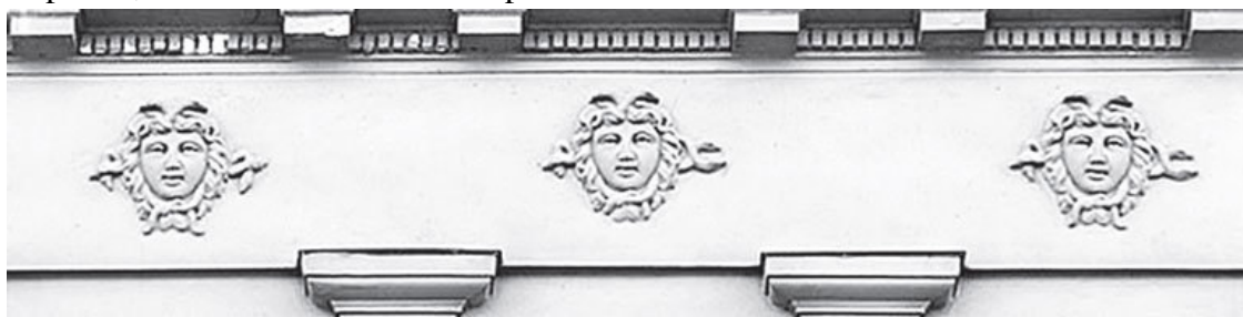
В. О., 9-я линия, 54

– Какой там Шекспир! «Что он Гекубе, что ему Гекуба?...» Любая картина любого гения всего-навсего холст и краски – с формальной, народно-хозяйственной, материалистической точки зрения, и больше ничего! А мы рыдаем!