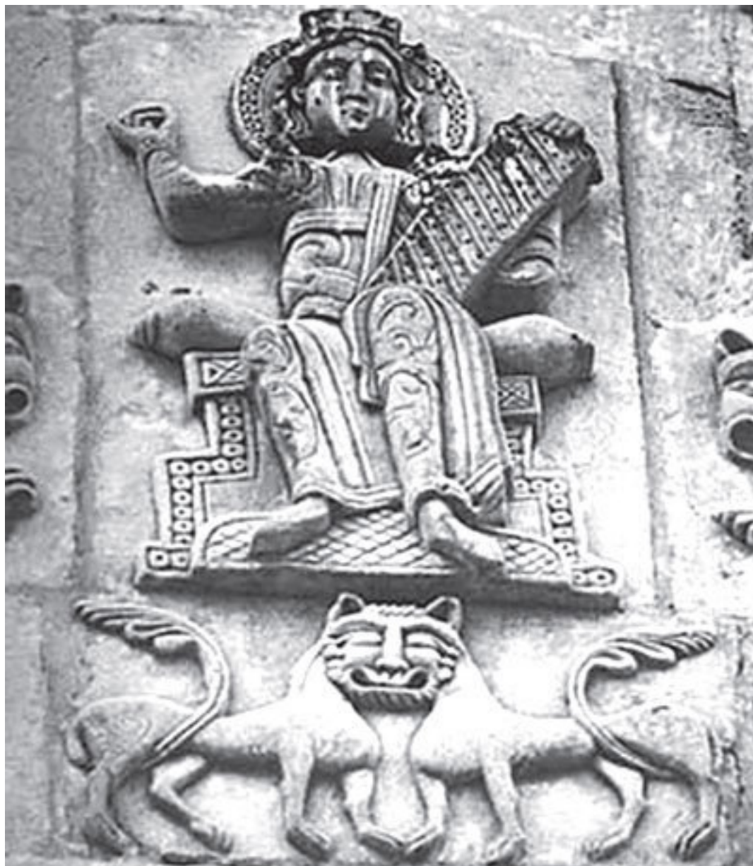
Давид Псалмопевец, Владимир. Дмитриевский собор. XII в.

«... Если романская скульптура на Западе стихийно развивалась в сторону обособления фигуры от стены, что нашло наиболее яркое выражение в ранней готике (вторая половина XII – первая треть XIII в.), то на Руси художественная эволюция протекала в обратном направлении. Тяжелый высокий рельеф, таивший в себе возможность перерождения в круглую скульптуру, был переведен русскими мастерами на язык деревянной резьбы, а затем подчинен тому орнаментально-плоскостному началу, которое всегда так ценилось древнерусским художником с его любовью к узорочью. Тем самым круглая скульптура лишилась необходимых для ее успешного развития предпосылок. Это своеобразное явление можно особенно хорошо изучить на примере рельефов Георгиевского собора. Когда сопоставляешь его колончатый пояс с аркатурным 11 фризом в Нотр Дам де Гранд в Пуатье и церкви в Рюффеке (Шарант), делается очевидным совсем иной подход русского художника к пластике» 12 .