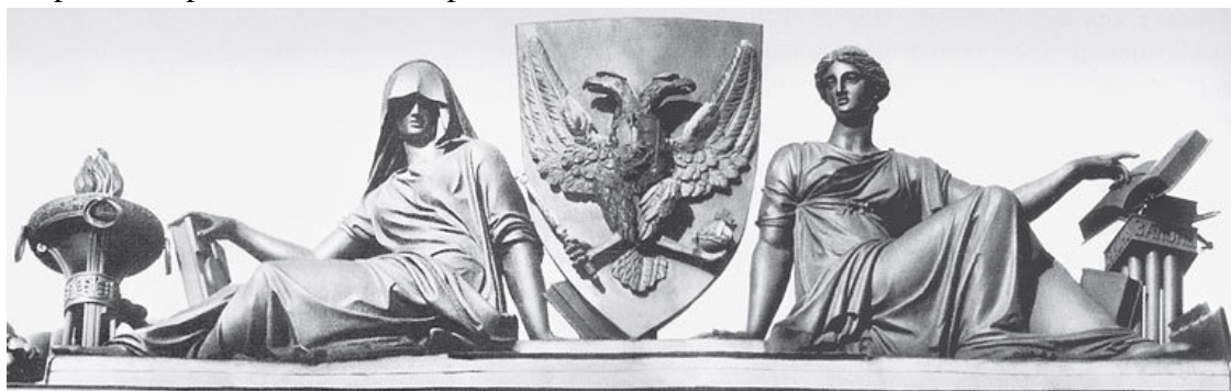
Сенатская пл., 1–3

Аллегория ( греч. allegoria – иносказание) – изображение отвлеченной идеи (понятия) посредством образа; художественное обособление отвлеченных понятий посредством конкретных представлений. Религия, любовь, справедливость, раздор, слава, война, мир, весна, лето, осень, зима, смерть и т. д. изображаются и представляются как живые существа. Прилагаемые этим живым существам качества и наружность заимствуются от поступков и следствий того, что соответствует заключенному в этих понятиях обособлению, например обособление боя и войны обозначается посредством военных орудий, времен года – посредством соответствующих им цветов, плодов или же занятий, справедливость – посредством весов и повязки на глазах, смерть – посредством клепсидры 17 и косы.