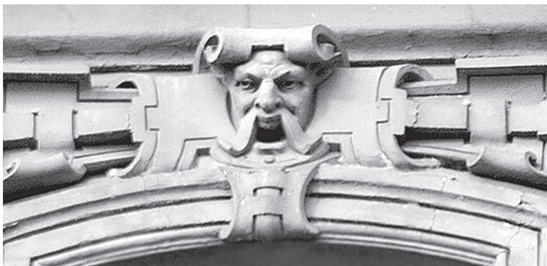
Ул. Рылеева, 18/40

Совсем маленьким я увидел странную картинку. Дед с бабкой сидели на заборе и пили чай из самовара, а к забору приляпана кошка! Она, не смущаясь странностью своего положения, терла лапой мордочку – «намывала гостей». Прошло, наверное, года два, когда мне снова попала в руки эта картинка, и я увидел, что «забор» – это дощатый пол в избе. Прежде, два года тому назад, я по молодости лет не видел перспективу – воспринимал картинку плоско, как, например, орнамент. Теперь «глаз воспитался», возникло понимание – «видение» перспективы, и все стало на место.