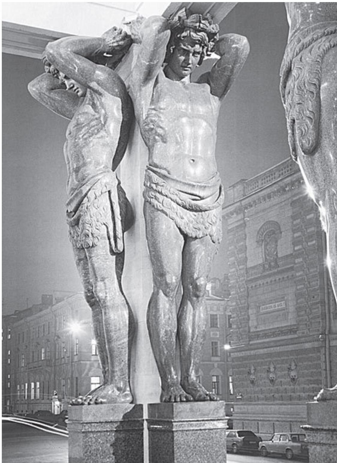
Миллионная ул., 35

Я помню серое питерское небо сквозь эту зияющую дыру. Я радовался, когда ее залатали. А еще помню, как ликовал город, когда везли (вопреки всем инструкциям и рекомендациям не по частям, а в собранном виде) восстановленного Петергофского Самсона.