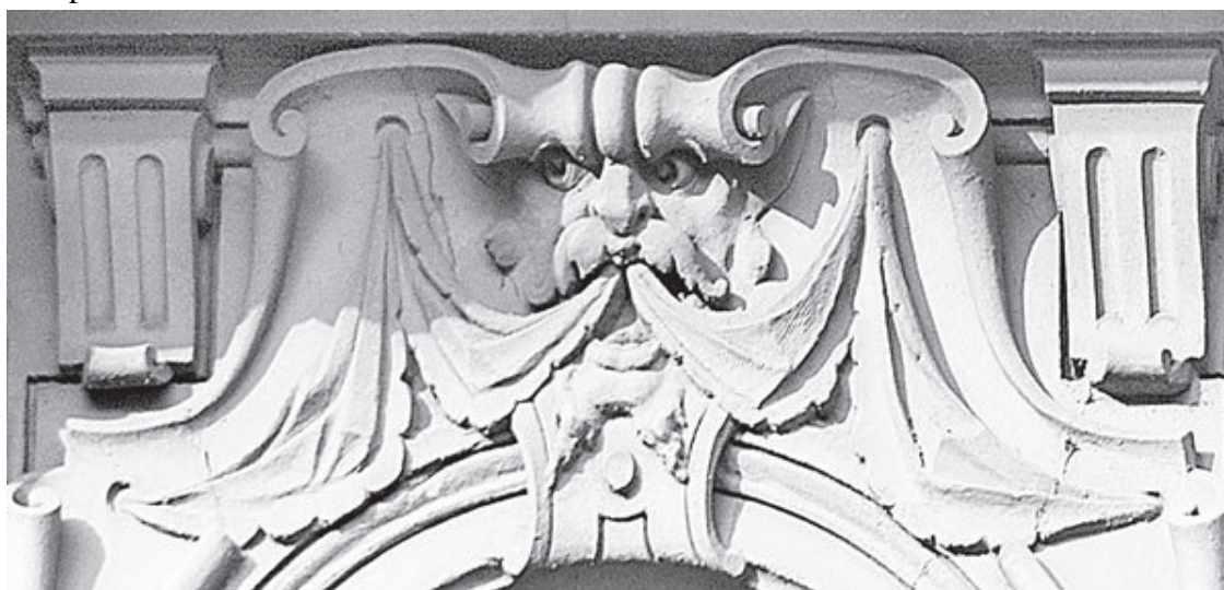
Ул. Рылеева, 18/40

Бородатое лицо белело над запертыми железными воротами. Я пошел прямо к нему по отблескам света на мокром булыжнике мостовой – маскарон продолжал смотреть на меня. Я специально уклонялся то влево, то вправо – взгляд преследовал меня неотрывно. И только когда я подошел совсем близко к воротам и глянул на него снизу вверх, ощущение направленного на меня каменного взгляда исчезло. Что было тому виной? Вечер? Мятущийся свет тусклого фонаря? Воображение подростка, развитое занятиями в художественной школе? Да! Конечно! Но не только. Пройдитесь в сумерках по залам любого музея, взгляните в портреты и убедитесь – не только вы смотрите в лица живших прежде людей, из глубины прошлого и они смотрят на вас!