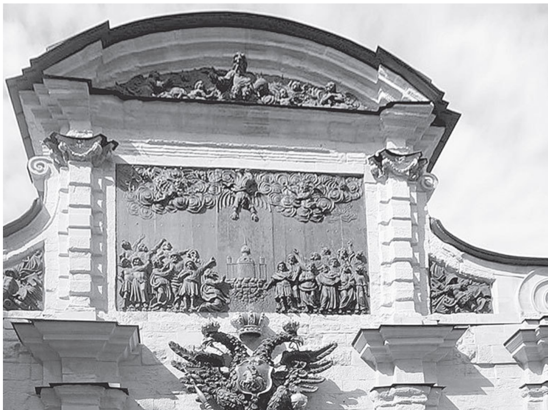
Петровские ворота Петропавловской крепости

Между тем этот Симон – фигура очень любопытная, и современникам Петра было абсолютно ясно, почему барельеф, повествующий о низвержении Симона-волхва, красуется над крепостными воротами новой столицы.