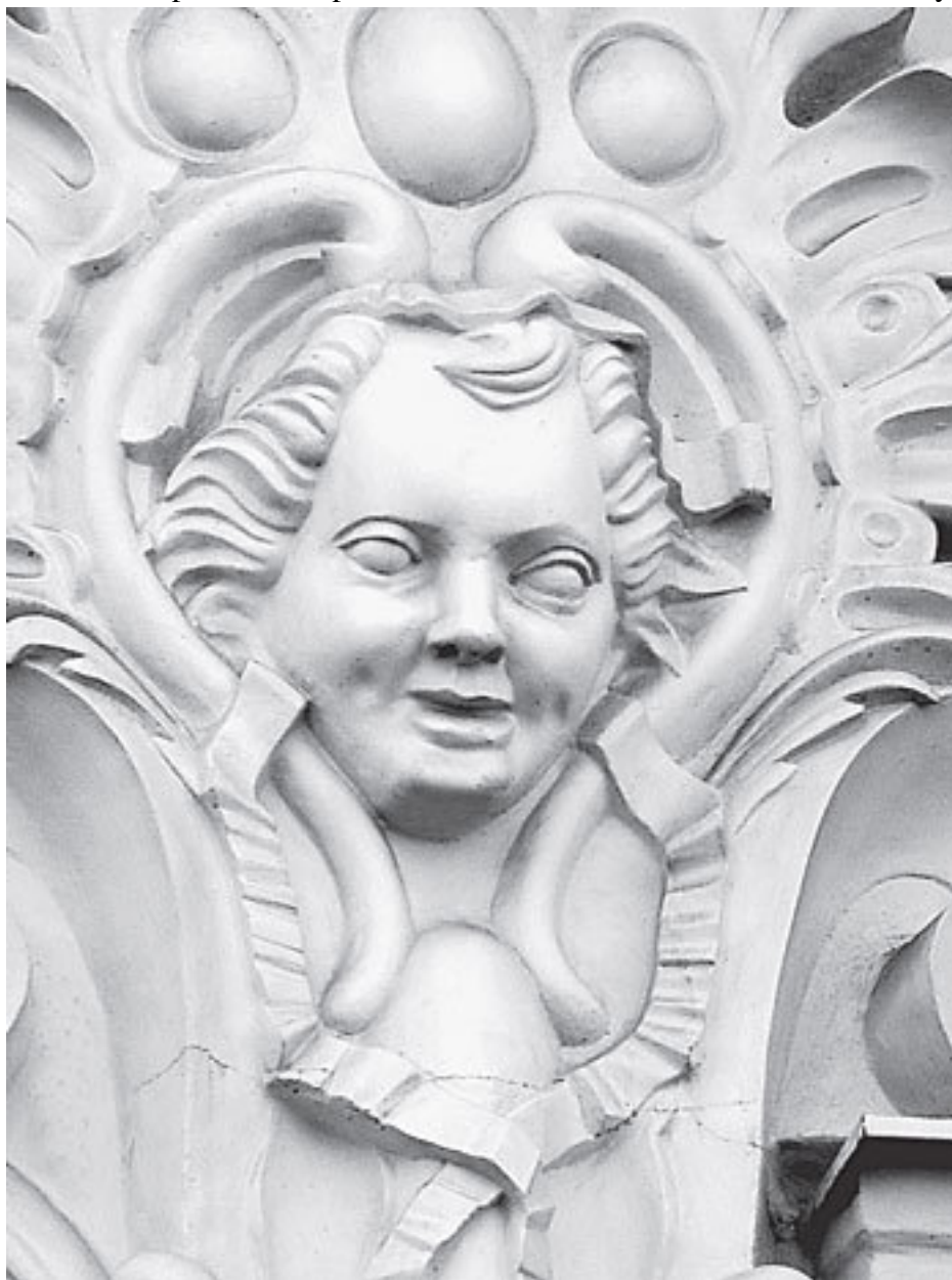
Невский пр., 17

и неправдами выпихивал сына за границу – учиться зодчеству. Франческо, переименованный в России в Варфоломея Варфоломеевича, ездил в Европу шесть раз! И что самое радостное, в отличие от многих российских дворянских недорослей, привезших из Франции только наимоднейшие камзолы, парики и венерические болезни, действительно много чему выучился.