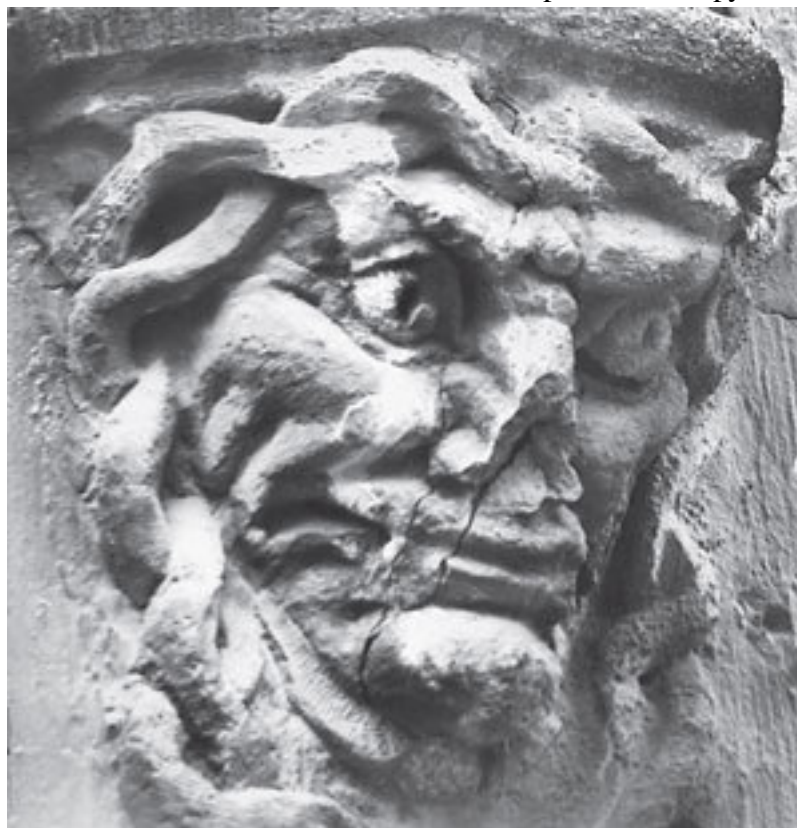
Ул. Белинского, 11

лированный медный щит на ее отражение. В знаменитой серебряной скульптуре Бенвенуто Челлини Персей поднимает только что отрубленную голову чудовища, но стоит, опустив глаза, страшась сам попасть под смертоносный взгляд Медузы, поскольку и отрубленная голова горгоны сохранила свои колдовские свойства и осталась смертоносным оружием.