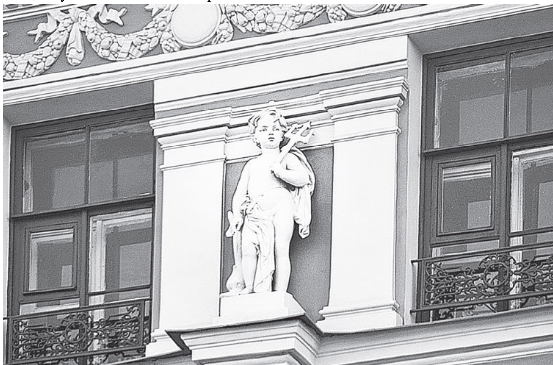
Наб. р. Мойки, 82

В славянской народной поэзии своя символика: фиалка – символ девственности, барвинок – брака, любисток – любви, василек – чистоты и святости, хмель – волокитства, лоза – бедности, голубь – любви, пава – нарядности, селезень – жениха, сова – зловестия.