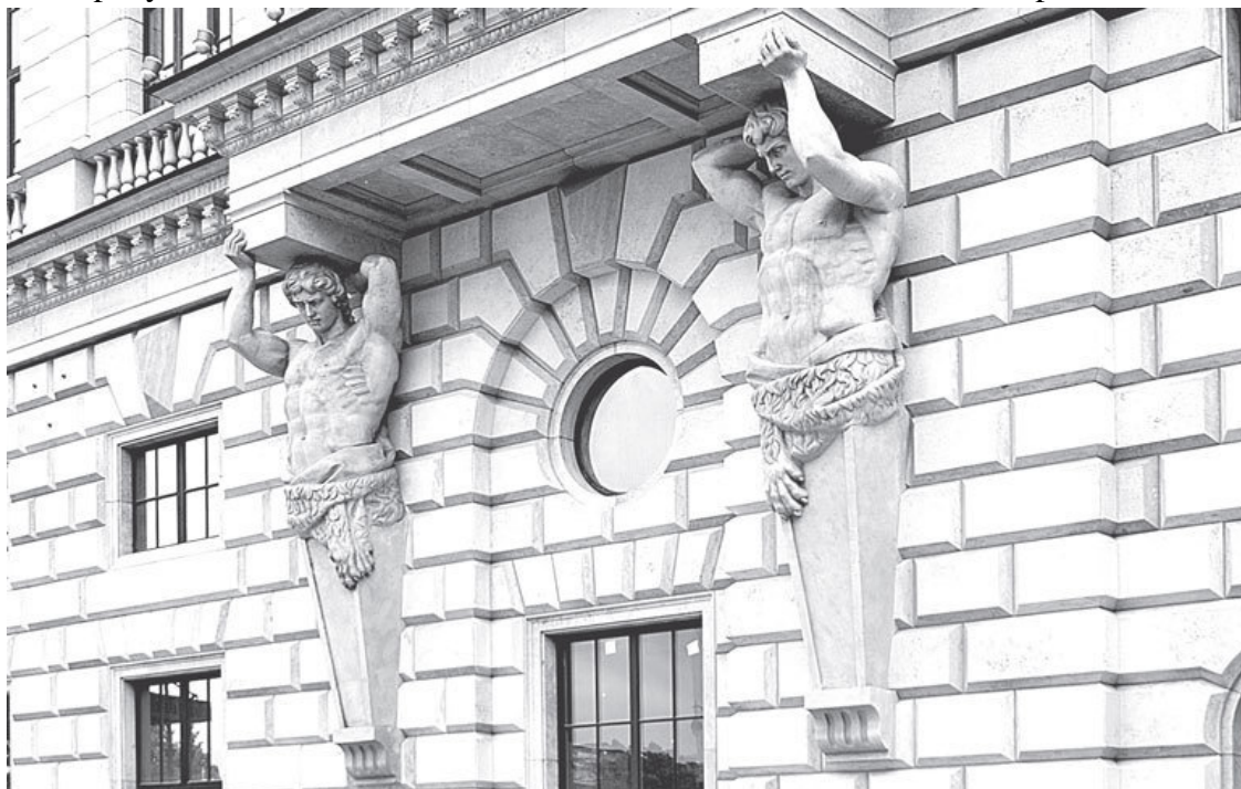
Пл. Островского, 2а

Между собою бородачи сильно похожи, разница в атрибутике: у Нептуна – трезубец, за спиною Зевса – орел; а если это маскарон – лицо, соответствующий орнамент и атрибуты: у Зевса – дубовые ветви, у бога сна Морфея – цветы мака, у Нептуна – раковины, у Диониса – виноград и т. д. (Подробнее об этом см. «Аллегии, символы, атрибуты, эмблемы и девизы».) Титан Атлант, как правило, стоит с непокрытой головой, а вот у Аполлона, кроме лаврового венка, в атрибутике бывают колосья пшеницы как символа солнца и плодородия.