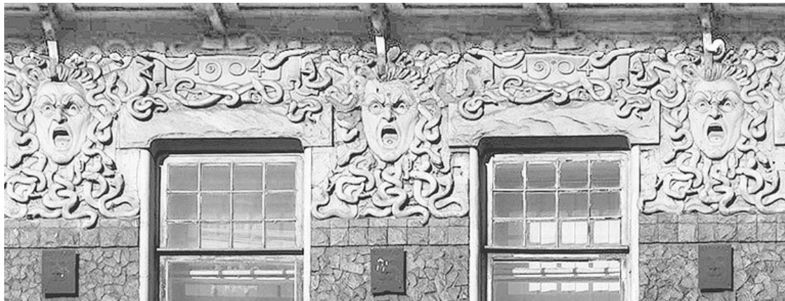
Ждановская наб., 9

Точное понимание смысла маски тесно связано с уяснением религиозных представлений и вообще мировоззрения и образа мышления народов на различных ступенях культурного развития; прогресс в изучении масок является, поэтому, тесно связанным с успехами этнологии и истории первобытной культуры вообще.