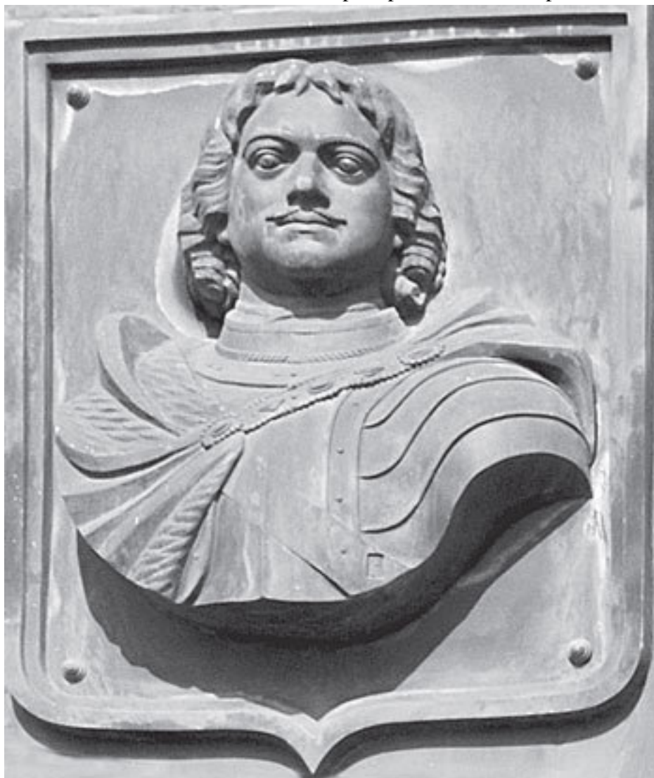
Невский пр., 26

неведением, не захотели признавать ее верховенства и, заключив ее в оковы чувственно-телесного бытия, заставили последовательно переходить из одного женского тела в другое. Она явилась, как гомеровская Елена, виновницу Троянской войны, а через 1000 лет очутилась проституткою в Тире, где Симон, следивший за всеми ее превращениями, подобрал ее, как добрый пастырь потерянную овцу. Известие о путешествии Симона-волхва в Рим и его успехах там – правдоподобно, но эти успехи, конечно, не доходили до почестей со стороны императора и сената. Сборник рассказов II века, ложно приписанных Клименту Римскому, содержит много подробных легенд о Симоне и его долгом противоборстве с апостолом Петром в Кесарии и в Риме, о его неудачной попытке вознестись на небо и воскреснуть из гроба, куда по его требованию ученики положили его живым, однако через три дня нашли мертвым.