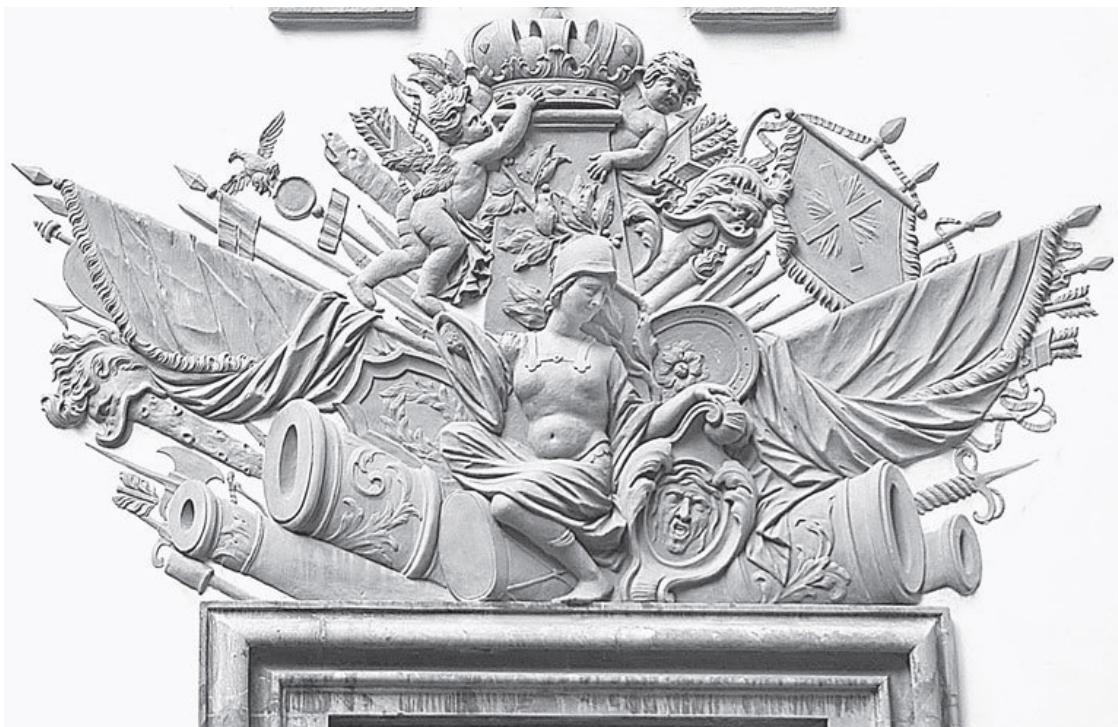
Минерва, аллегория победы. Летний дворец Петра в Летнем саду

Но в XVIII веке произошла полная смена образного языка. Начиная с формы. Если для западного христианина круглая и декоративная скульптура привычна, скажем, тысячи скульптур готических соборов он «читал», как православный клейма на иконах, то для русского человека такое не просто необычно, но святотатственно! Святых не положено ваять в круглой скульптуре! Нельзя создавать идолов и кумиров! А здесь не просто рельефное изображение, здесь языческие боги! «Сатанинское наваждение»! Православный люд возроптал и смутился!.. Однако, как писал поэт В. Соснора: «Они посмущались, но смуты не произошло!»