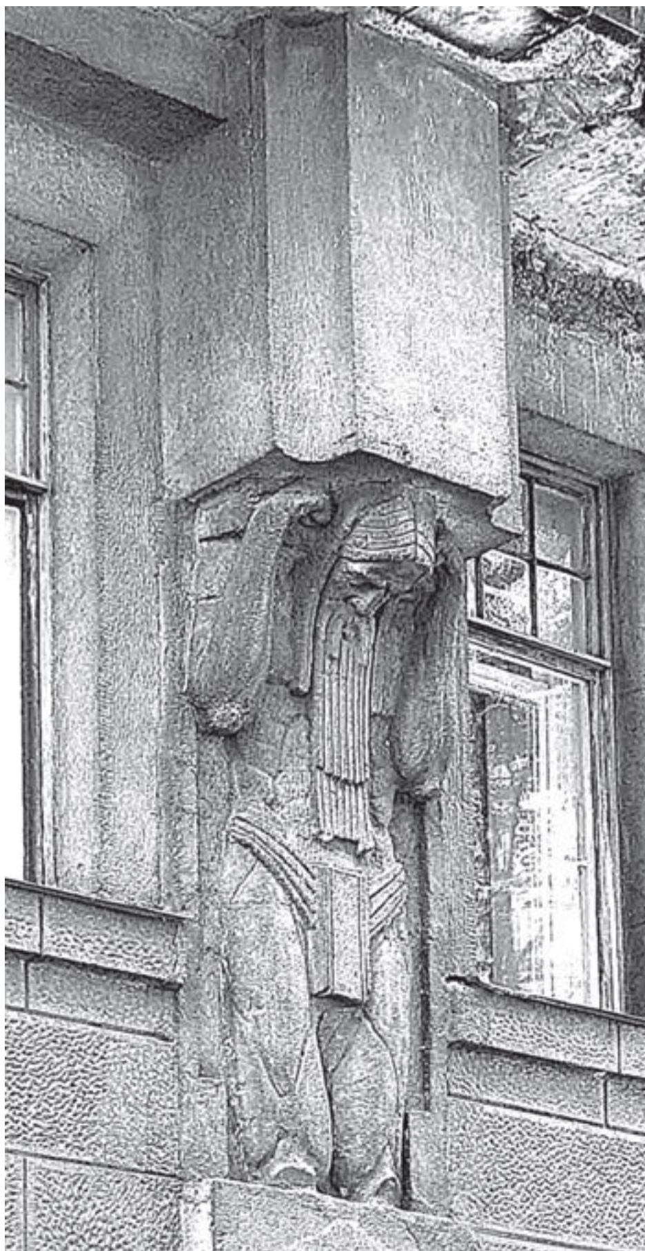
Ул. Некрасова, 58–60