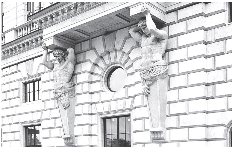
Пл. Островского, 2а

У Эрмитажа «ребята» молодые и безбородые да еще в венках из пшеничных колосьев – стало быть, не Атланты! А кто же? Есть у них другое название, менее употребляемое – куросы.