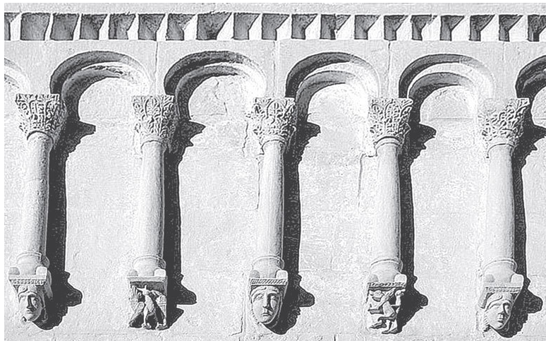
Аркатурный пояс. Церковь Покрова на Нерли. XII в.

производили орнаментирование низа стен, полуколонн, пилястр и т. п., а также орнаментирование фона верхних фигурных композиций. Узор рисовали, потом процарапывали. Лишь после этого выбирали его фон, резали вглубь детали орнамента и, наконец, скругляли его контуры. Подобный способ работы еще в большей мере сближал рельефы с изделиями из драгоценных металлов, которые, без сомнения, были использованы в Юрьеве-Польском как образцы.