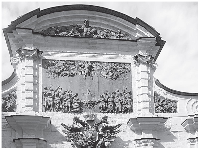
Петровские ворота Петропавловской крепости

ского смысла барельеф типичен для петровского барокко и совершенно непонятен нашим современникам, не знающим, кто такой Симон-волхв, падающий из облаков. Без объяснений совсем непонятно, «кто над нами вверх ногами».