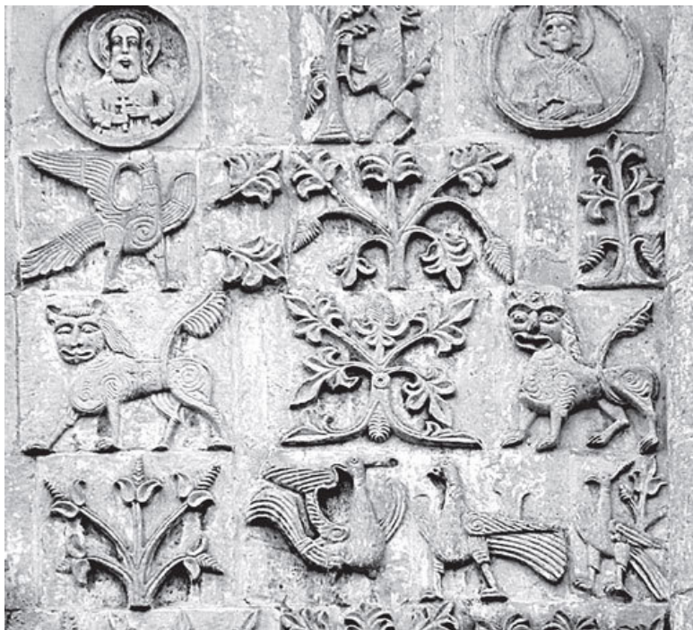
Барельеф. Владимир. Дмитриевский собор. XII в.

Интересно, как в Средневековье русские мастера резали камень. «У нас есть теперь возможность восстановить практиковавшийся в Юрьеве-Польском метод работы. Сначала были выполнены на земле и поставлены на места все изображения более высокого рельефа (при этом фоны оставались гладкими). Затем, уже по поверхности выложенного камня,