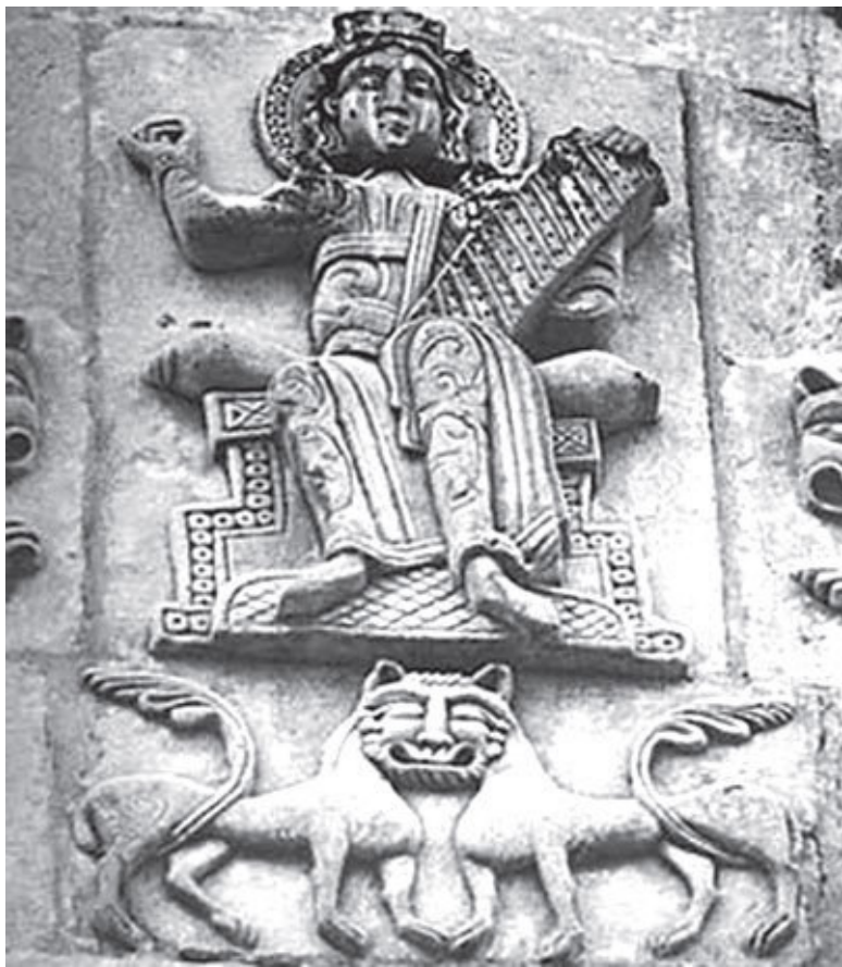
Давид Псалмопевец. Владимир. Дмитриевский собор. XII в.

«... Если романская скульптура на Западе стихийно раз-