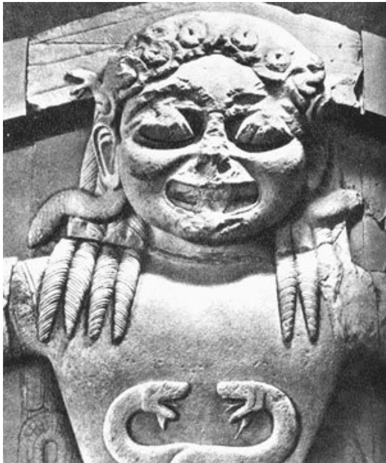
Фронтон храма Артемиды на о. Корфу

Маски, в частности горгульи, располагались над дверьми