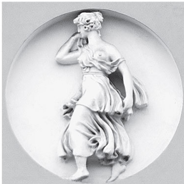
Наб. р. Мойки, 23

Их мать Мнемозина (богиня памяти) – дочь Геи (богиня Земли) и Урана (бог Неба). От этого брака родились еще и титаны, в том числе Прометей и Атлант, которым Мнемозина, выходит – сестра? А Атлант, получается, музам – дядя? Муз Мнемозина родила от Зевса, стало быть, Аполлон – сын Зевса и Геры – всем музам сводный брат. Сплошная семейственность!