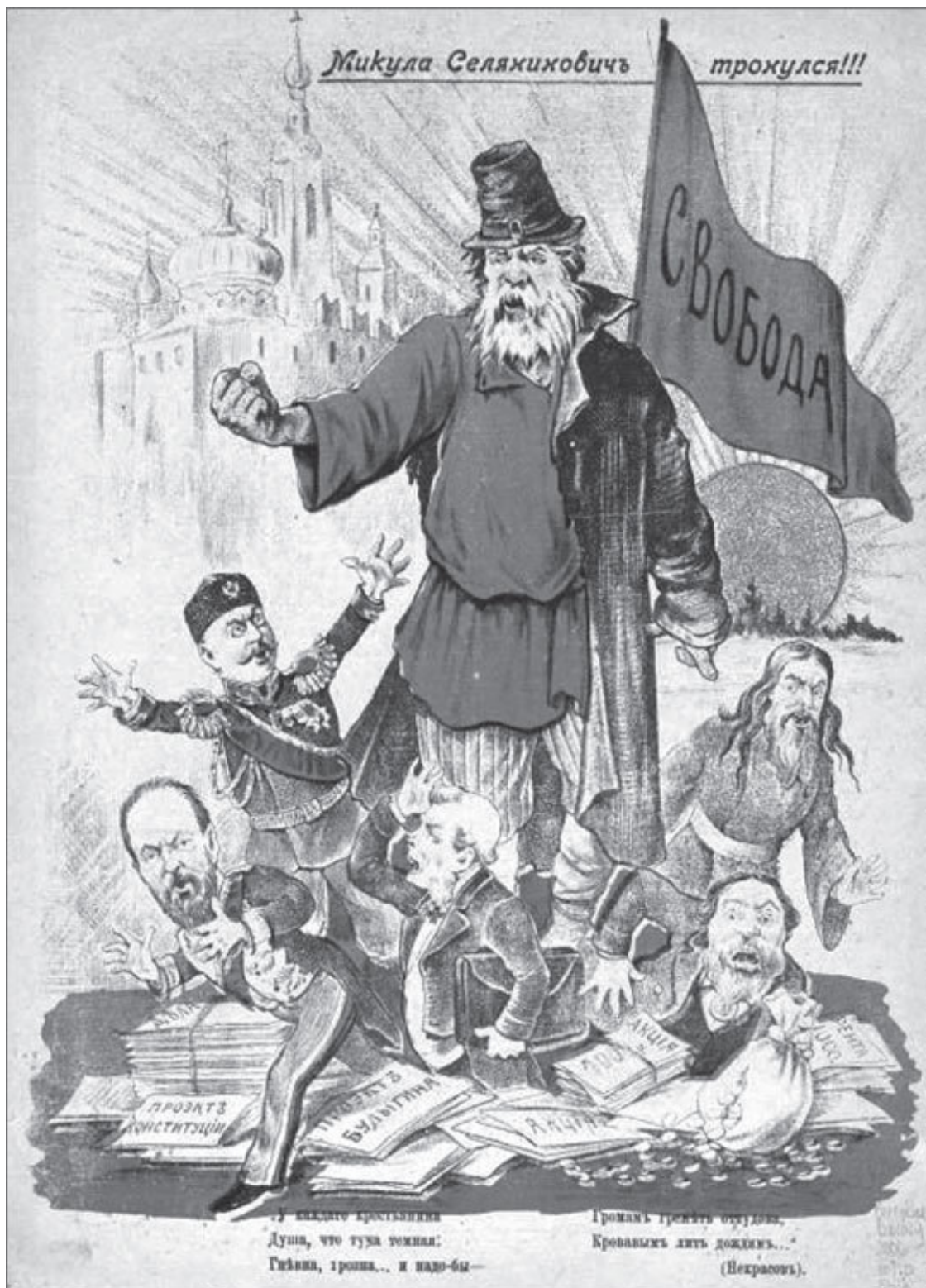
Иллюстрация из сатирического журнала. 1905 год

Нападения на полицейских случались в Петербургской губернии и после подавления Первой русской революции. Так, в Лужском уезде урядник Константин Кравец-Кравцов пострадал дважды: первый раз его избили крестьяне деревни Дубровки во время беспорядков, а второй раз, в день объявления приговора суда над виновными, 7 августа 1908 года, в той же деревне он был убит. Вдове назначили пенсию в 120 руб. в год.