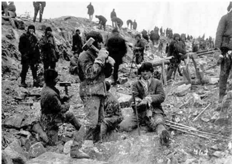
Работа заключенных в ГУЛАГе

В 1943 году секретным приказом НКВД вводятся новые нормы питания немецких военнопленных. В полтора раза больше хлеба, больше овощей. Возвращается в рацион мясо, животные жиры. Рацион теперь дифференцируется по званиям, тяжести исполняемых работ и состоянию здоровья. Эти нормы все еще недостижимы в блокадном Ленинграде.