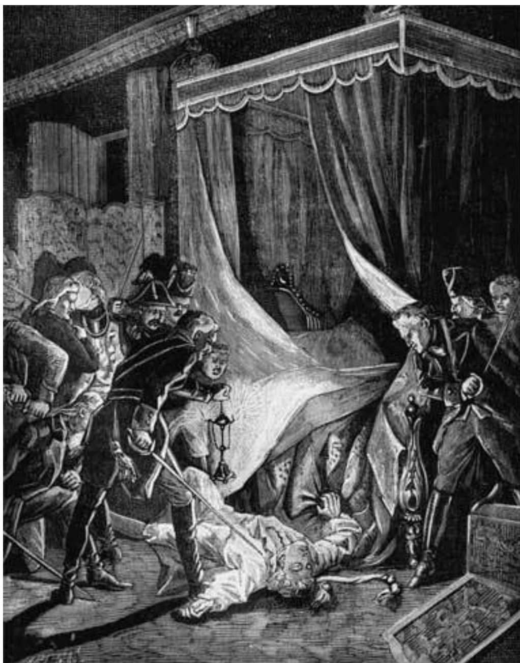
Убийство императора Павла I. Старинная гравюра

Так печально, с убийства, начался XIX век.