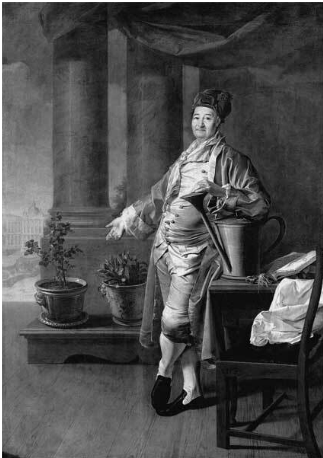
П. А. Демидов. Художник Д. Г. Левицкий

Петр погрузил свой нехитрый скарб в кибитку, простился с Демидовым, и скоро уже весело бежали лошади, неся торопливую тройку по Санкт-Петербургской дороге. В памяти его вставали столичные знакомцы: шумный Капнист, насмешливый Львов и милый Иван Хемницер. Вспоминал ссору с хозяином петербургской квартиры, зловещие звуки его возмущенной скрипки. Какие злые силы поднимались со дна души этого немца? И что он за злодей?