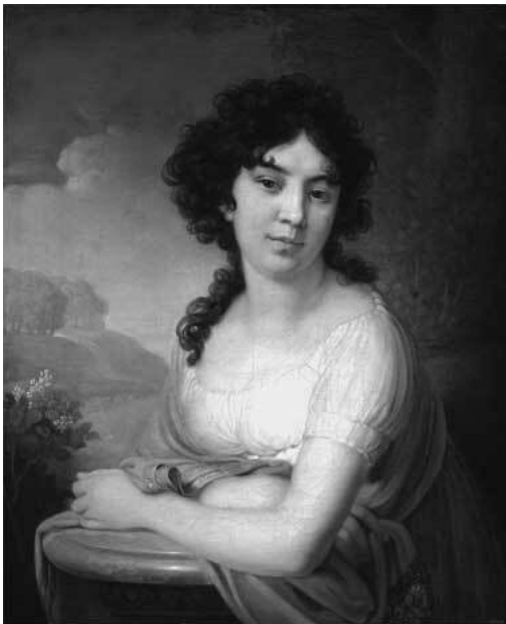
А. П. Лопухина. Художник В. Л. Боровиковский