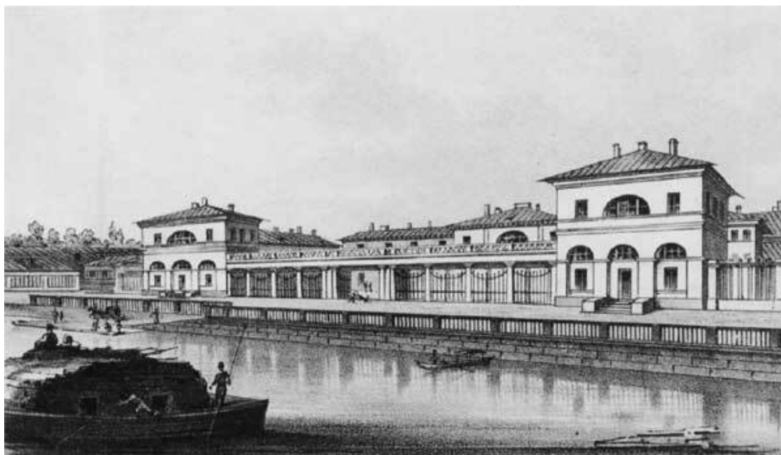
Дом-усадьба Г. Р. Державина

Издал так называемую «Львовскую летопись», найденную им в Суздале, – важнейший труд древнерусской словесности. Пушкин заимствовал сюжет «Песни о вещем Олеге» из «Львовской летописи», хранившейся в его библиотеке.