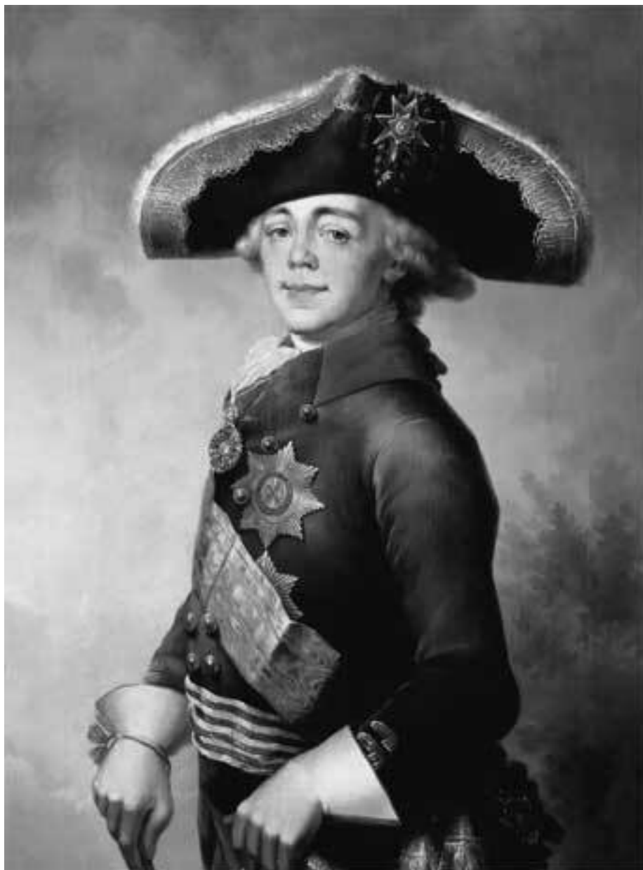
Портрет императора Павла I. Художник В. Л. Боровиковский