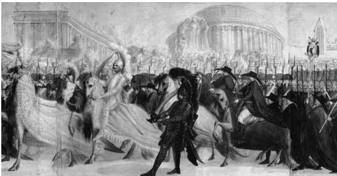
Перезахоронение Петра III и похороны Екатерины II. Старинная гравюра

Так началось царствование Павла I и закончилась славная пора деятельности его матери. Что же, объяснение всему этому есть. Мать и сын испытывали друг к другу антипатию. Екатерина была умна и хитра, еще при жизни ее называли Великой. От своих многочисленных государственных дел, которые она начинала вести с 6 утра, императрица находила утешение в фаворитах, а сын – в фантазиях и мечтах. Она не любила масонов, он же увлекался масонской литературой. В его памяти громоздились не только истории о славных рыцарских временах, прекрасных дамах, о временах тамплиеров, но и легенды о масонах. Так, он любил читать рассказ «Перстень (масонская сказка)»: