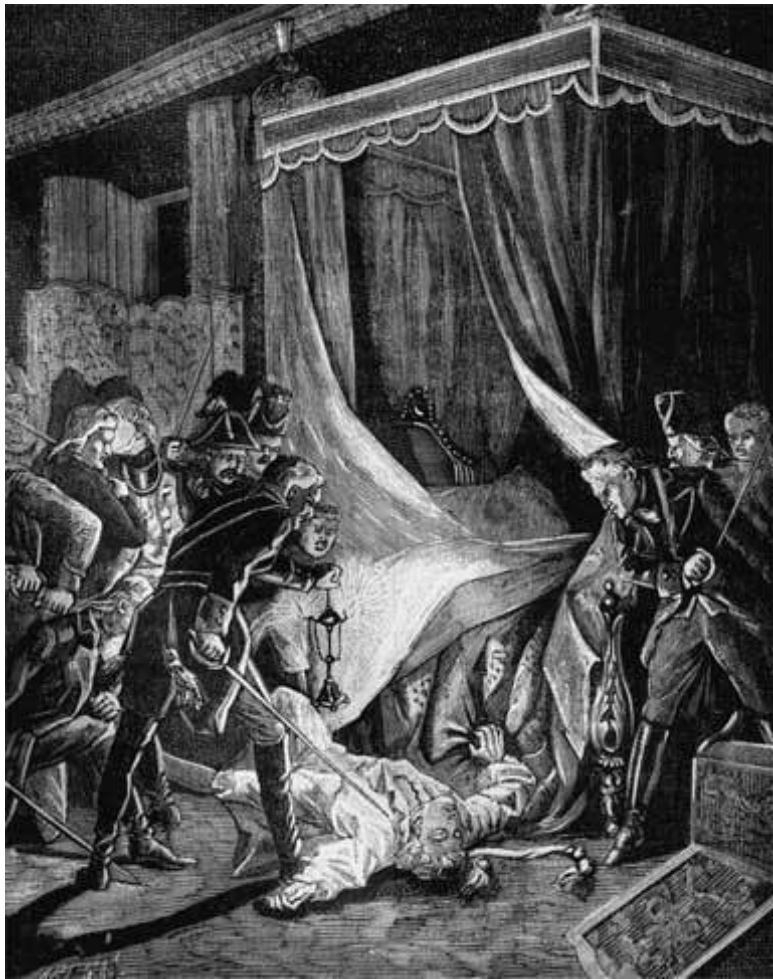
Убийство императора Павла I. Старинная гравюра