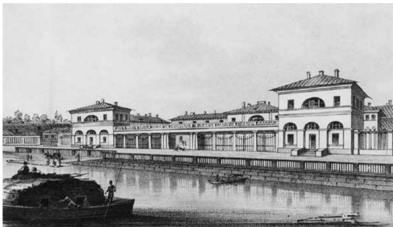
Дом-усадьба Г. Р. Державина

Издавал так называемую «Львовскую летопись», найденную им в Суздале, – важнейший труд древнерусской словесности. Пушкин заимствовал сюжет «Песни о вещем Олеге» из «Львовской летописи», хранившейся в его библиотеке.