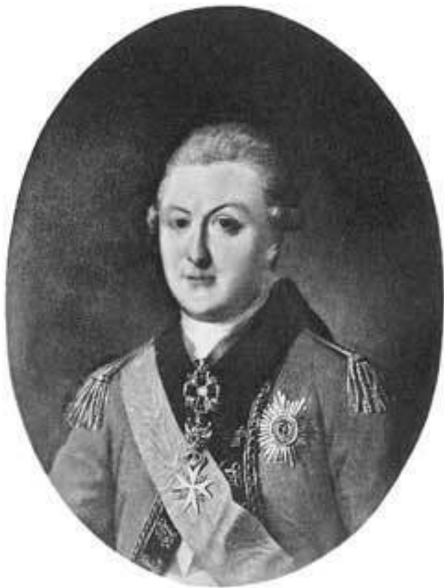
П. Г. Гагарин. Неизвестный художник

шел царь и засмеялся: «Это твоя шляпа, князь, возьми ее». После этого князь из полковника стал генерал-адъютантом.