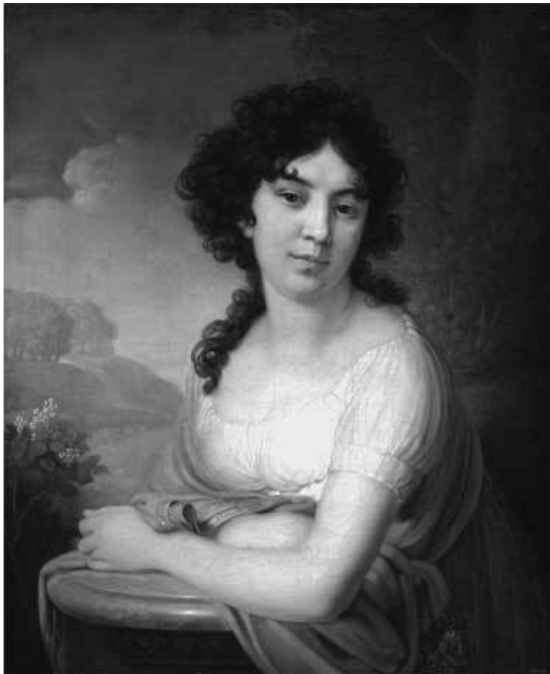
А. П. Лопухина. Художник В. Л. Боровиковский