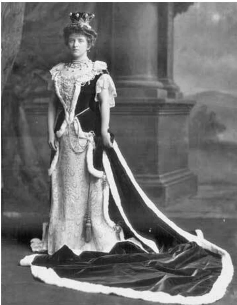
Графиня Альмина Карнарвон

вала за больным, который вскоре отошел в лучший мир. К счастью, она не прекратила тогда финансирование экспедиции Говарда Картера, понимая всю значимость эпохального открытия.