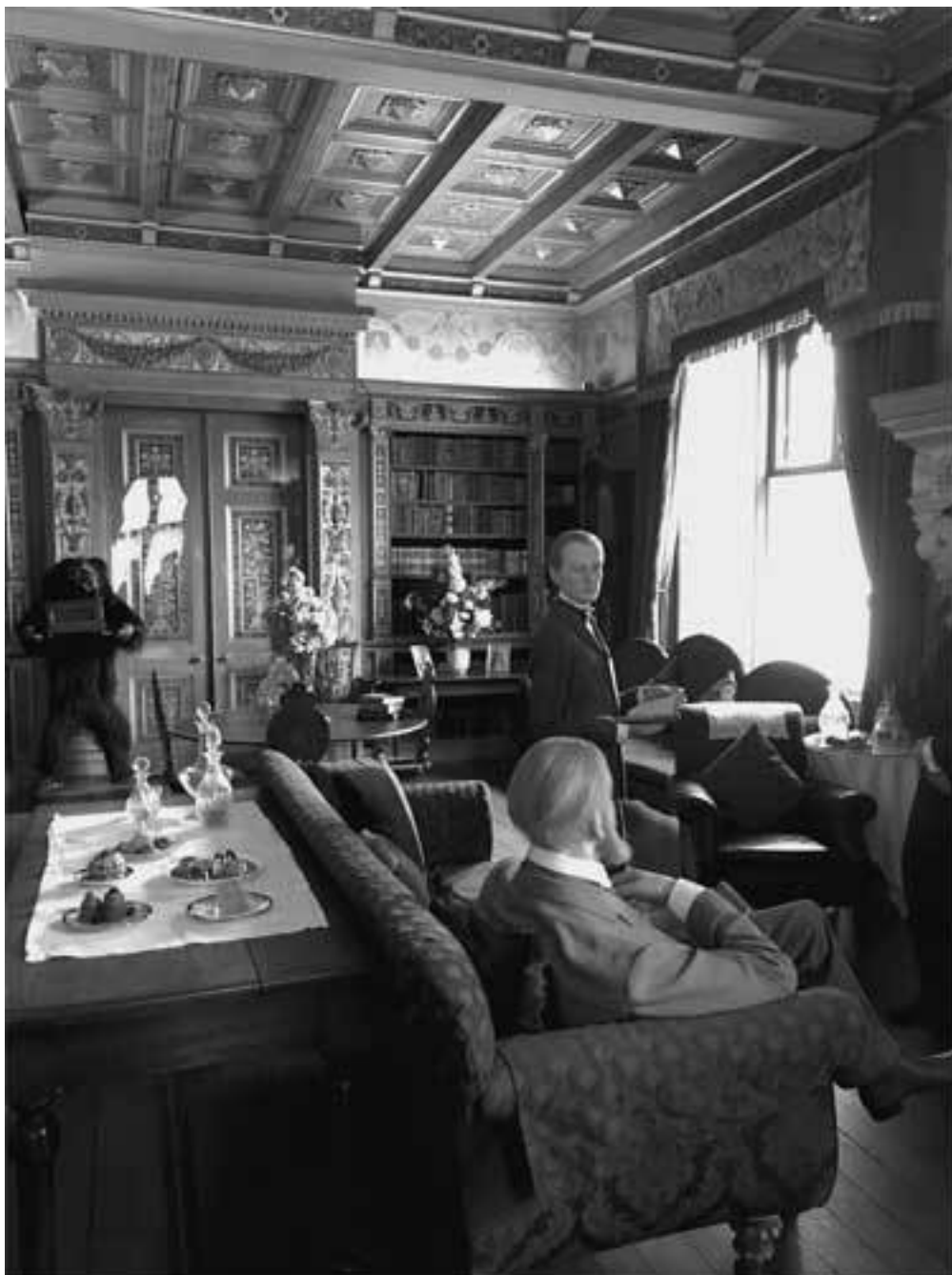
В библиотеке замка Уорвик

В Курительной комнате играют в карты двое джентльменов – сын Берти, будущий король Георг V, кузен нашего Николая II, похожий на него как две капли воды, и Санни, как называют в близком кругу 9-го герцога Мальборо. Его жена, тоненькая и воздушная Консуэло Вандербильт, вес которой придавало лишь ее баснословное американское приданое, спасшее Мальборо от разорения, тоже в замке, в Китайской спальне, в кружевном розовом пеньюаре. Совсем недавно она стала герцогиней и матерью наследника. А в исторической спальне, обшитой резными дубовыми панелями, достойными будущего короля, слуга готовит напитки для принца Берти, частого гостя этого дома и сердечного друга Дейзи, и его собеседника лорда Керзона – на тот момент еще не вице-короля Индии и не министра иностранных дел, а его заместителя. Керзон, тогда еще счастливо женатый на красавице американке Мэри Лейтер – само воплощение перфекционизма – волосок к волоску, идеально сидящий костюм и цепкий взгляд холодных глаз.