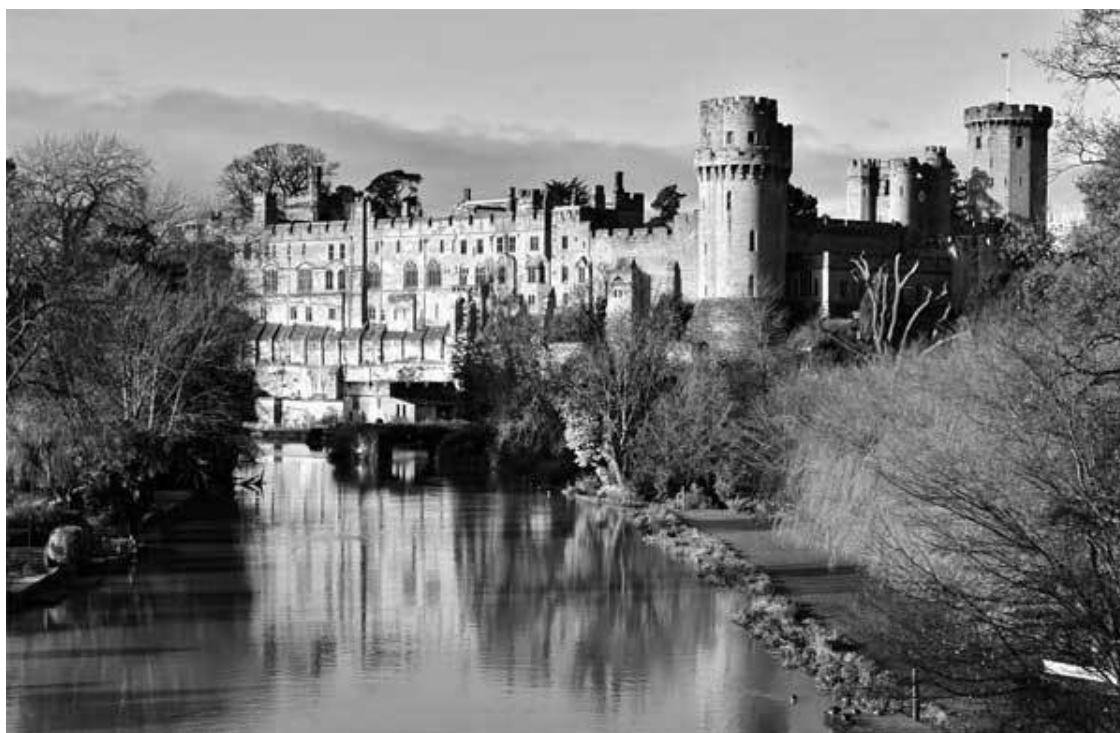
Замок Уорвик в Оксфордшире

Четверть века назад я, начинающий гид, впервые оказалась в старинном и величественном замке Уорвик в Оксфордшире, который ведёт своё начало от самого Вильгельма Завоевателя. Сколько раз за 10 веков здесь бряцало оружие и гремели рыцарские доспехи, пировали короли и королевы, бушевали любовные страсти. Бойницы, темницы и блистательные турниры, викторианский розовый сад и павлиний променад идут здесь в комплекте с привидением – дух бывшего владельца Фулке Гревилла, заколотого собственным слугой, особенно часто навещает свою бывшую обитель.