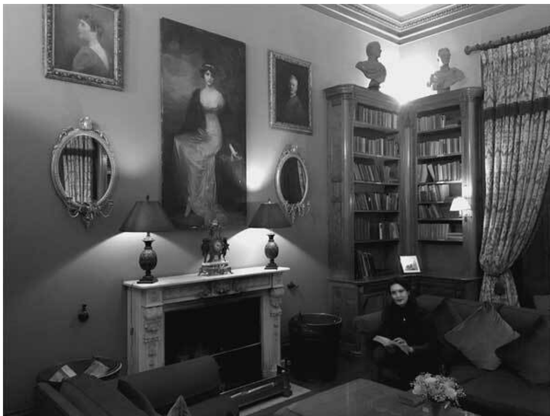
Библиотека в замке Лесли.