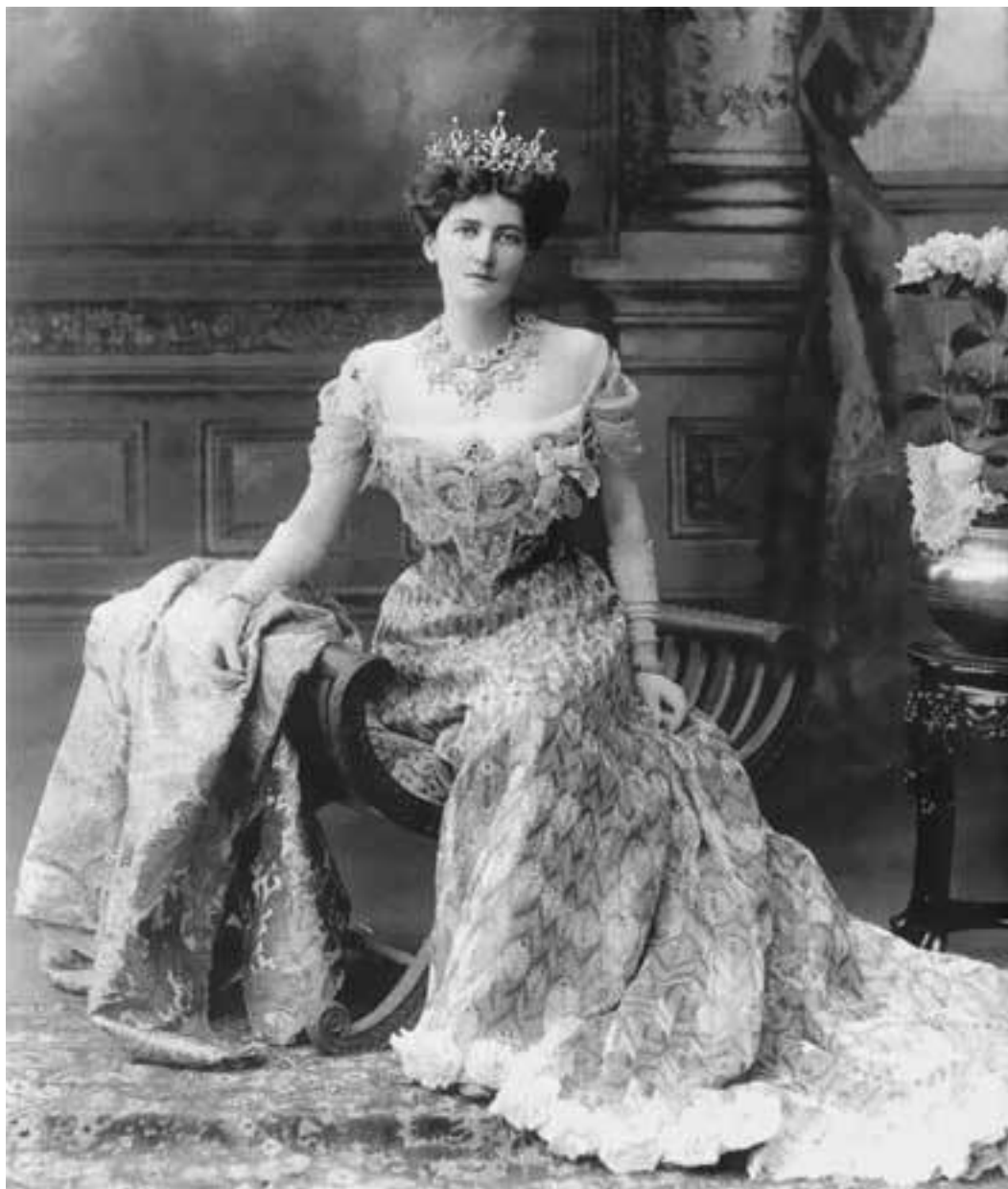
Леди Керзон в знаменитом «павлиньем платье»