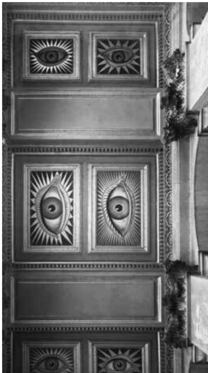
Глаза на портике Бленхеймского дворца

Дворец порастил размахом, величием и монументальностью. Со своей задачей – увековечить победу 1-го герцога Мальборо в битве при Бленхейме – архитектор справился блестяще, правда, о том, что это еще и семейный дом, он, по-видимому, не особо задумывался, потому под гулками каменными сводами вестибюля, в длинных комнатах со знаменами и сценами военных баталий на гобеленах чувствуешь себя, как в музее. Недаром Джон Ванбру изначально числился драматургом – творил, как будто создавал свой героический эпос в камне.