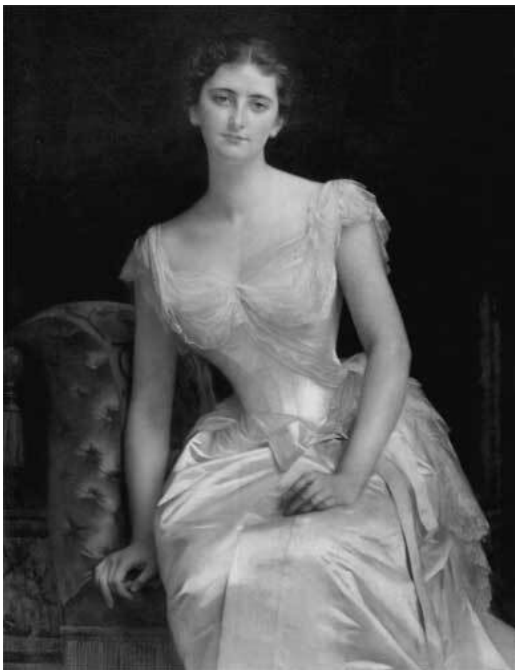
Мэри Виктория Лейтер

Еще одна американская наследница – Адель Грант – становится графиней Эссекской, а знаменитая Консуэло Вандербильт, одна из главных героинь нашей книги, в 1985 году получает титул герцогини Мальборо в обмен на приданое в 2 миллиона фунтов, что в наши дни составило бы примерно 80 миллионов, дабы удовлетворить амбиции своей властной матери. Ко всему этому прилагались и фамильные сокровища. Еще 10 миллионов фунтов Вандербилты потратили на то, чтобы удержать Мальборо на плаву в последующие годы.