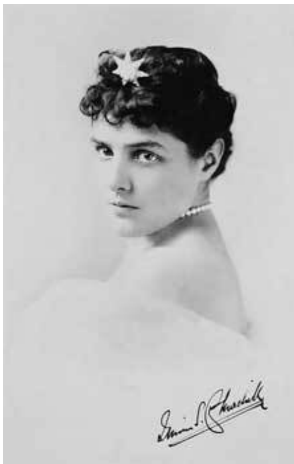
Дженни Джером (леди Дженни Спенсер-Черчилль)