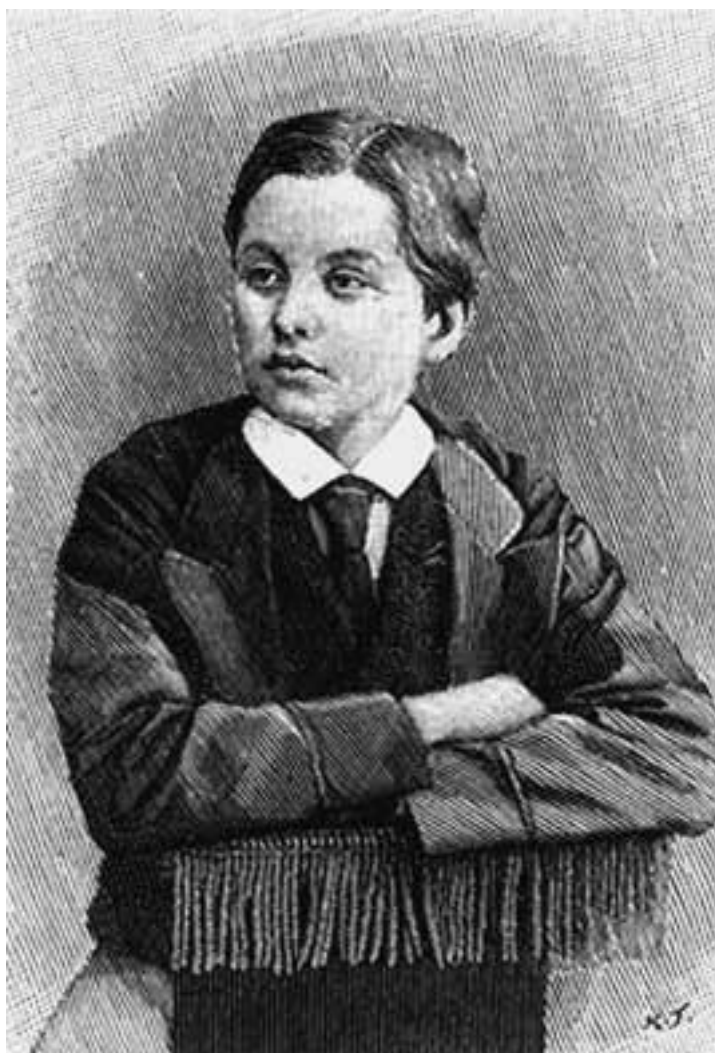
Джордж Натаниэль Керзон в юности

Впервые посетив Калькутту во время кругосветного путешествия в декабре 1887 года, Керзон, по свидетельству очевидцев, заявил, что в следующий раз войдет через городские ворота как вице-король. Индия, воистину, была романсом его юности, всепоглощающей страстью в зрелые годы и незабываемым прошлым в старости.