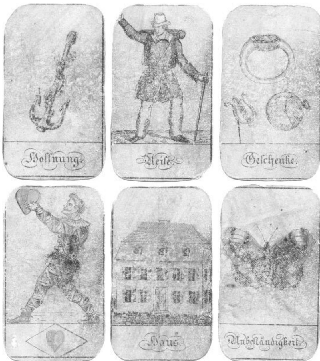
Рис. 1. Старинные карты Ленорман