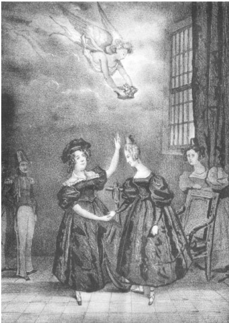
Рис. 5. Мадемуазель Ленорман сообщает свое предсказание герцогине Беррийской, принцессе Каролине

Остается неясным, какие карты она использовала, примкнув к нарастающему движению tireurs de cartes (карточных предсказателей). Встречаются упоминания о том, что на картах были изображения Тота и «странные фигуры». По ее собственным словам, она использовала «сияющее зеркало», «тридцать три греческие палочки», различные гримуары, магические жезлы и талисманы. О том Таро, которое известно нашим современникам, упоминаний не было.