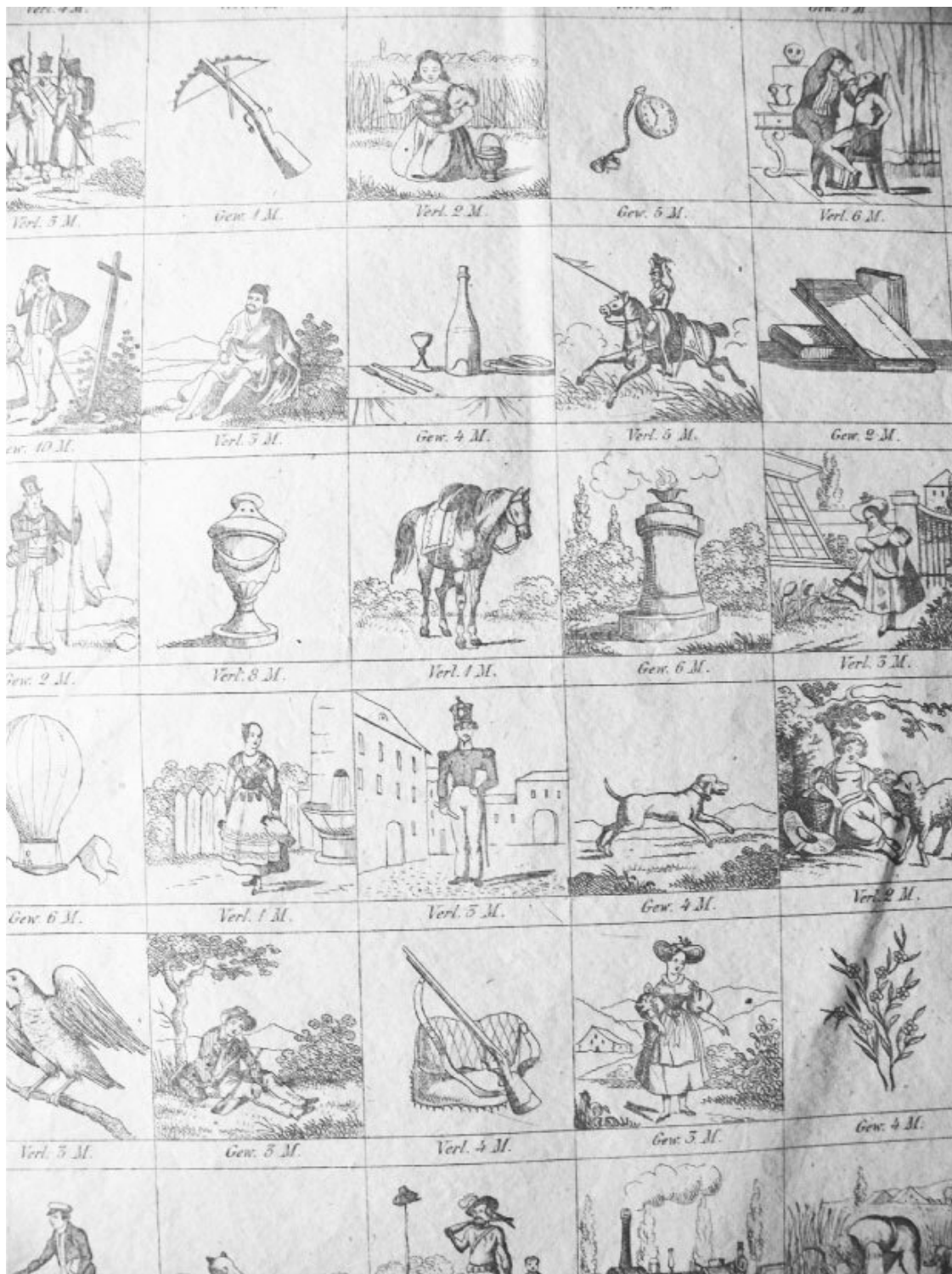
Рис. 7. Лотерейная таблица из Нюрнберга

из-за подобного поведения игрокам нечего «даже думать о счастье, и тем паче рассчитывать на него». В игре предусмотрены разные варианты расплаты, наказания за содеянное, например, «если кто станет клятвпреступником , того следует приковать к позорному столбу и оштрафовать на одну единицу». Упоминаются такие варианты наказания, как плаха и порка. Стиль игры сильно изменился: если прежде поощрялась социализация с использованием алкогольных напитков и азартных игр, как в «Игре удачи» ( Game of Chance ), то впоследствии в моду вошли нравственно-воспитательные игры.