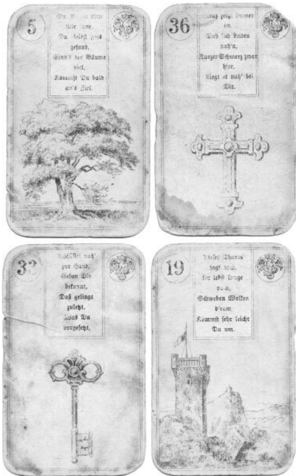
Рис. 2. Старинная колода Ленорман, изданная Дондорфом

На данный момент наиболее комплексным и надежным англоязычным исследованием эволюции карт Ленорман и жизни мадемуазель Ленорман можно назвать книгу «Коварная колода карт» трех авторов: Декер, Депуали и Думметт ( A Wicked Pack of Cards, Decker, Depualis,