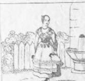
Verl. 1 M.