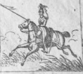
Verl. 5 M.