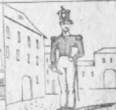
Verl. 5 M.