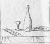
Gen. 4 M.