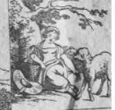
Verl. 2 M.