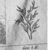
Gen. 4 M.