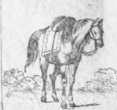
Verl. 1 M.