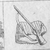
Verl. 4 M.