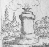
Gen. 6 M.