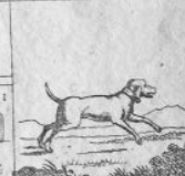
Gen. 4 M.