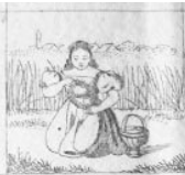
Verl. 2 M.