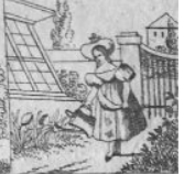
Verl. 5 M.