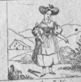
Gen. 5 M.