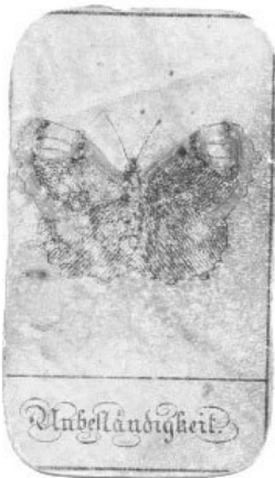
Рис. 1. Старинные карты Ленорман