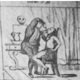
Verl. 6 M.