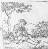
Gen. 5 M.