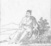
Verl. 5 M.