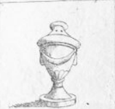
Verl. 8 M.