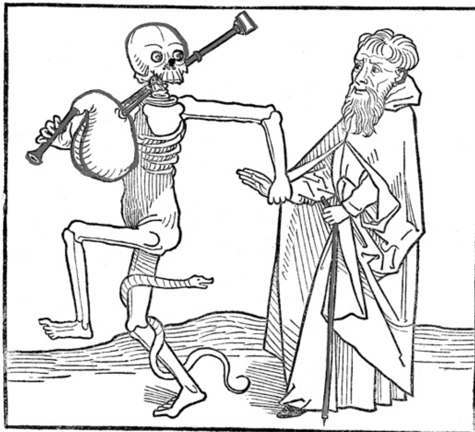
Смерть и брат [нищенствующего ордена]. Гейдельбергская пляска смерти, 1488