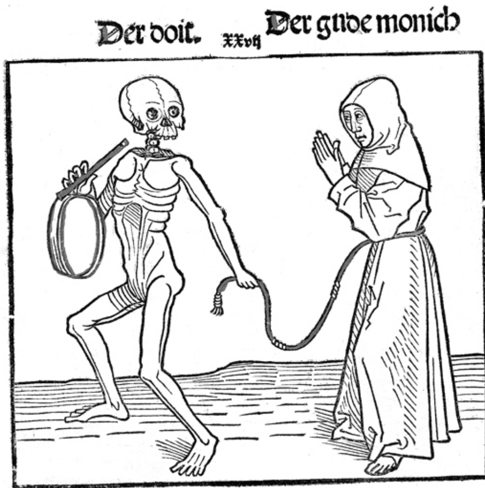
Смерть и хороший монах. Гейдельбергская пляска смерти, 1488

Обсерванты – участники движения за духовное обновление нищенствующих орденов XIV – начала XV вв. Выступали за возвращение к первоначальным идеалам бедности и строгому соблюдению правил ( regula ), составленных основателями этих духовных учреждений и утвержденных папой римским.