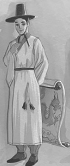
ПРИЗРАК СИН ЧАНЕЛЬ