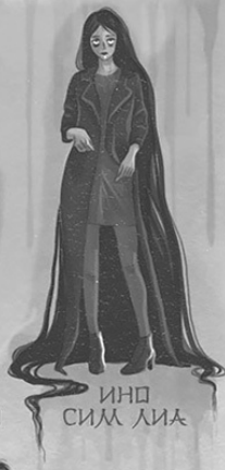
ИНД СИМ ЛИА