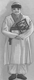
ПРИЗРАК АН ХЮНСУ