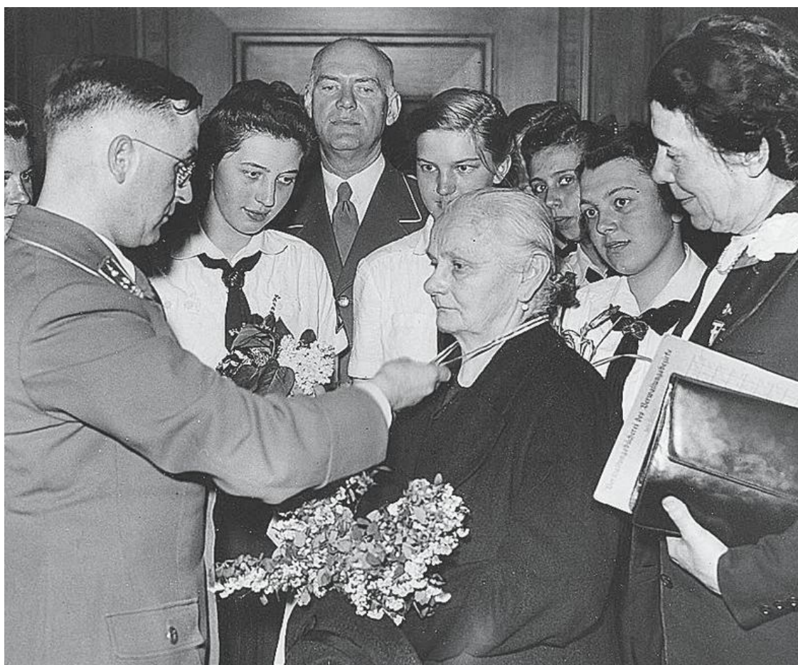
Награждение Почетным крестом немецкой матери

Интересно показывает автор противоречие между официальным национал-социалистическим патриархатом и той ролью в освобождении немецких женщин, которую сыграли необходимость пополнять рабочей силой заводы и жестокие бомбовые налеты союзников. В результате рейх из патриархального государства, где женщинам отводилась роль домохозяек или живых инкубаторов для разведения пушечного мяса, превратился в страну матерей, жен и сестер, фактически взявших на себя управление народной жизнью. Но случилось это уже в последние годы войны.