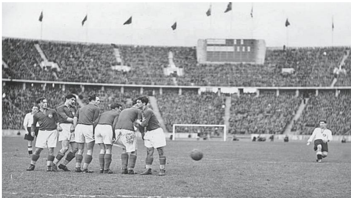
Матч Германия – Югославия (1939)