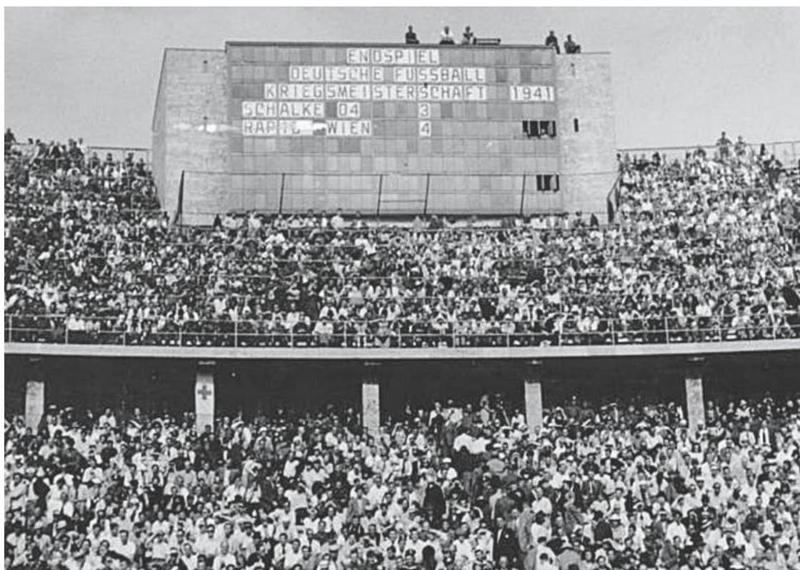
Болельщики «Шальке 04». На табло окончательный счет матча

Отдельного упоминания заслуживают (непредсказуемые) исторические параллели между инициативой Оберхубера и планами Гитлера. Манифест был опубликован в конце декабря 1940 года, как раз когда в обстановке секретности был утвержден план «Барбаросса» (Директива № 21). В отличие от неожиданно удачного блицкрига французской кампании 1940 года, который в реальности являлся чистой импровизацией, в план нападения на СССР Гитлер и его генералы изначально закладывали идею молниеносной войны. Кроме того, «образцово-агрессивный» матч между «Рапидом» и «Шальке 04» прошел как раз 22 июня 1941 года. Болельщики, собравшиеся на берлинском стадионе, заслушали официальное сообщение о начале войны с Советским Союзом 5 .