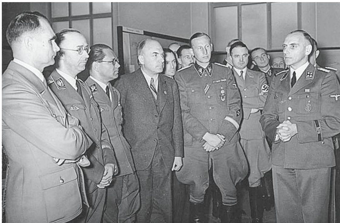
Р. Гесс, Г. Гиммлер, Ф. Боулер, Ф. Тодт и Р. Гейдрих (слева направо) на выставке «Планирование и построение нового порядка на Востоке»