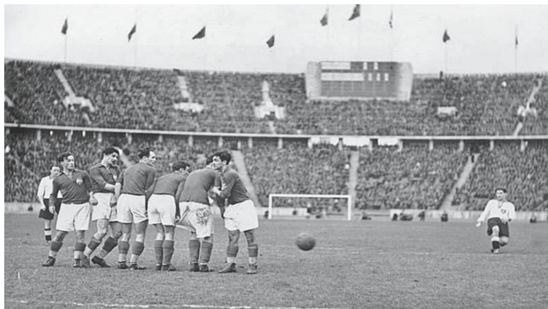
Матч Германия – Югославия (1939)