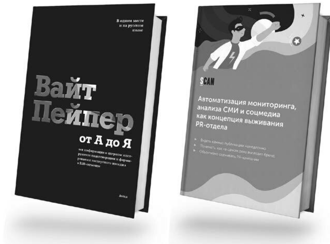
Пример внешнего вида вайт пейпера

Важно понимать, что вайт пейпер – часть контентной стратегии компании. Его цель – предоставить полезную информацию о решении определенной проблемы. Он также может раскрывать новый концепт или описывать процесс выполнения различных задач (маркетинговых, технических, финансовых, юридических и т. д.).