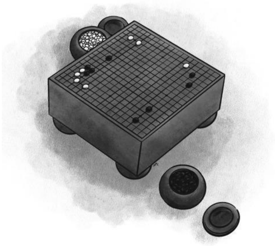
Рис. 1. Гобан и камни в чашах

Комплект го состоит из расчерченной сеткой доски и 360 камней черного и белого цвета по 180 штук каждого. Матрица игрового поля разлинована 19 вертикальными и 19 горизонтальными линиями, образующими в сумме 361 перекресток линий. Игровое поле в четыре раза больше шахматного. Серьезные поединки продолжаются часами.