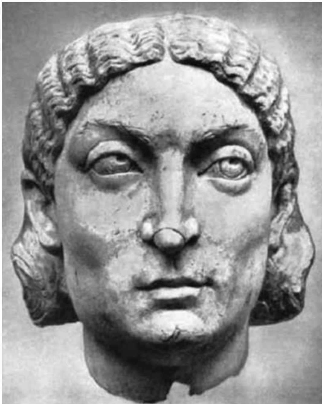
Портрет пожилой римлянки

Кто-то постучал в дверь. Хозяйка вышла и через минуту вбежала назад и испуганно шепнула Марию, что пришли члены городского совета. Два пожилых гражданина вошли в дверь.