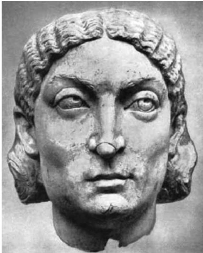
Портрет пожилой римлянки