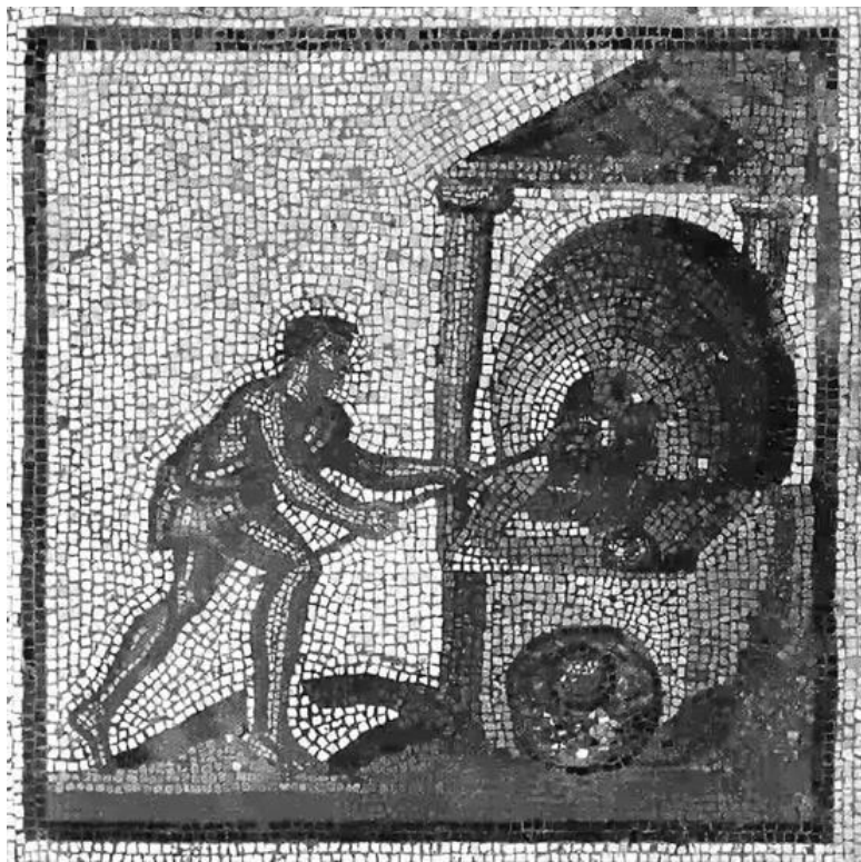
Римская гончарная печь

Однако в окрестностях города, вдоль всегда людных и шумных дорог, например дороги в Остию, Эмилиевой, Соляной и пр., по которым то и дело катились набитые пассажирами общественные крытые повозки и частные экипажи, все же можно было встретить сумрачные здания крепостных