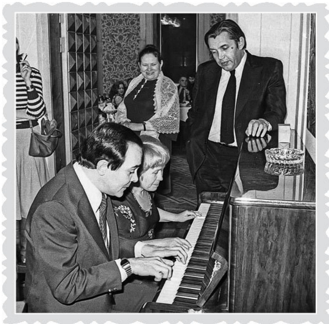
Дуэт Муслима Магомаева и Александры Пахмутовой. Роберт, видимо, поет. Про себя

щуюся пшеницу, не переставая качали нефть крошечные нефтяные вышки. Будничный и скромный герб, висевший над входом в телеграф, еще вчера совершенно не выделяющийся, за одну ночь приделся в объемный сияющий саркофаг из раскрашенных лампочек с детальной проработкой каждого колоска и каждого флажочка.