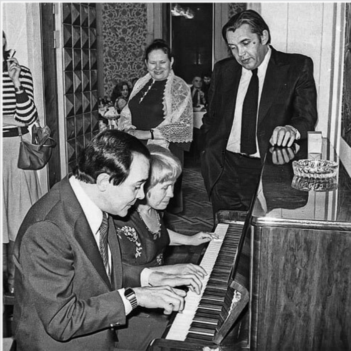
Дуэт Муслима Магомаева и Александры Пахмутовой. Роберт, видимо, поет. Про себя