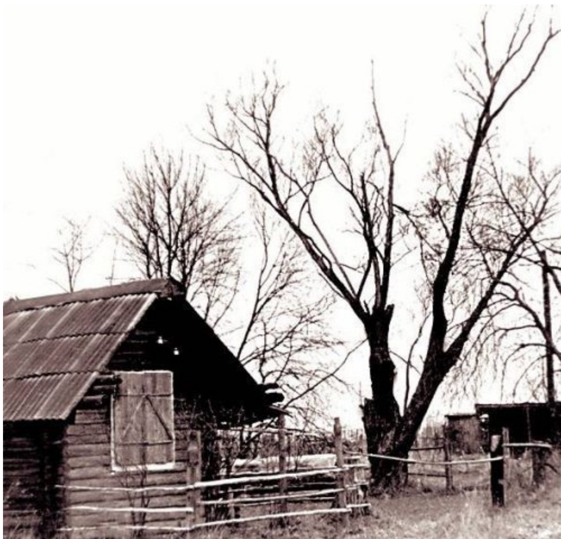
Князево. Единственная сохранившаяся до наших дней постройка рода Лемешевых – амбар для хранения зерна деда певца, Степана Ивановича Лемешева

Из построек прошлого века сохранился лабаз из красного кирпича, принадлежавший зажиточному крестьянину Ивану Ивановичу Буланову, у которого батрачили родители певца. До наших дней сохранился амбарчик деда, лишь немного изменился он с тех далеких времен. Сразу же за амбарчиком простирается ровный красивый луг. Князевцы называют его Кулига. В былые времена сюда приходили в большие праздники, в теплые летние вечера, в осенние сумерки. Тут пели песни, играли в лапту и в горелки, водили хороводы у костра, встречая рассвет, знакомились... С любовью вспоминает в своей книге Сергей Яковлевич об этом уголке деревни.