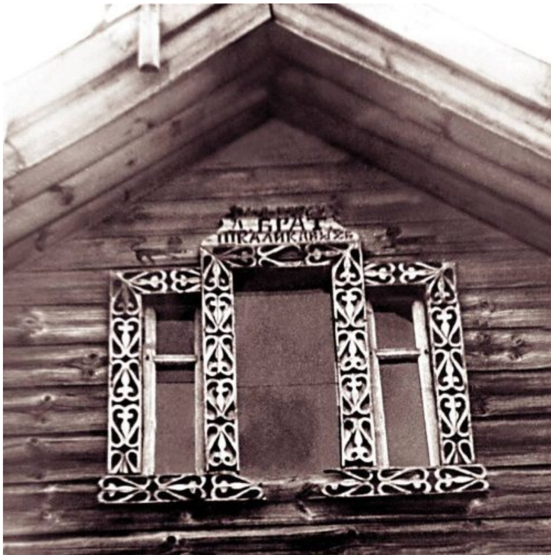
Фронтон бабушкиного дома