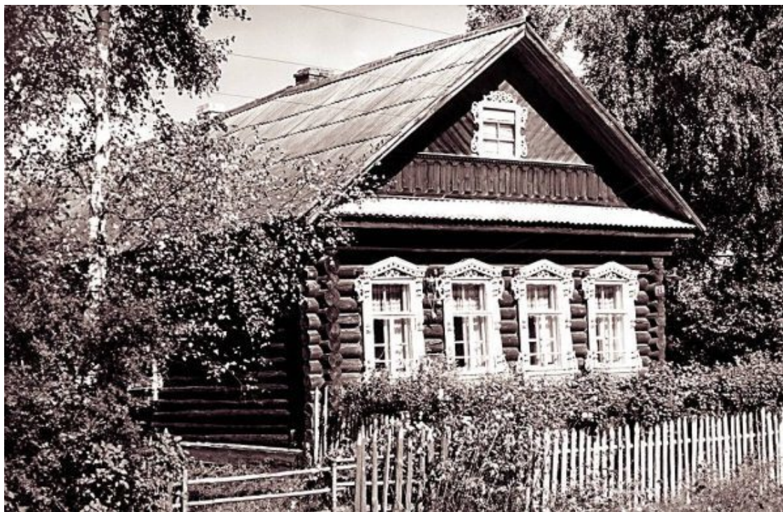
Дом Тихомировых. Стренево, 1997 г.