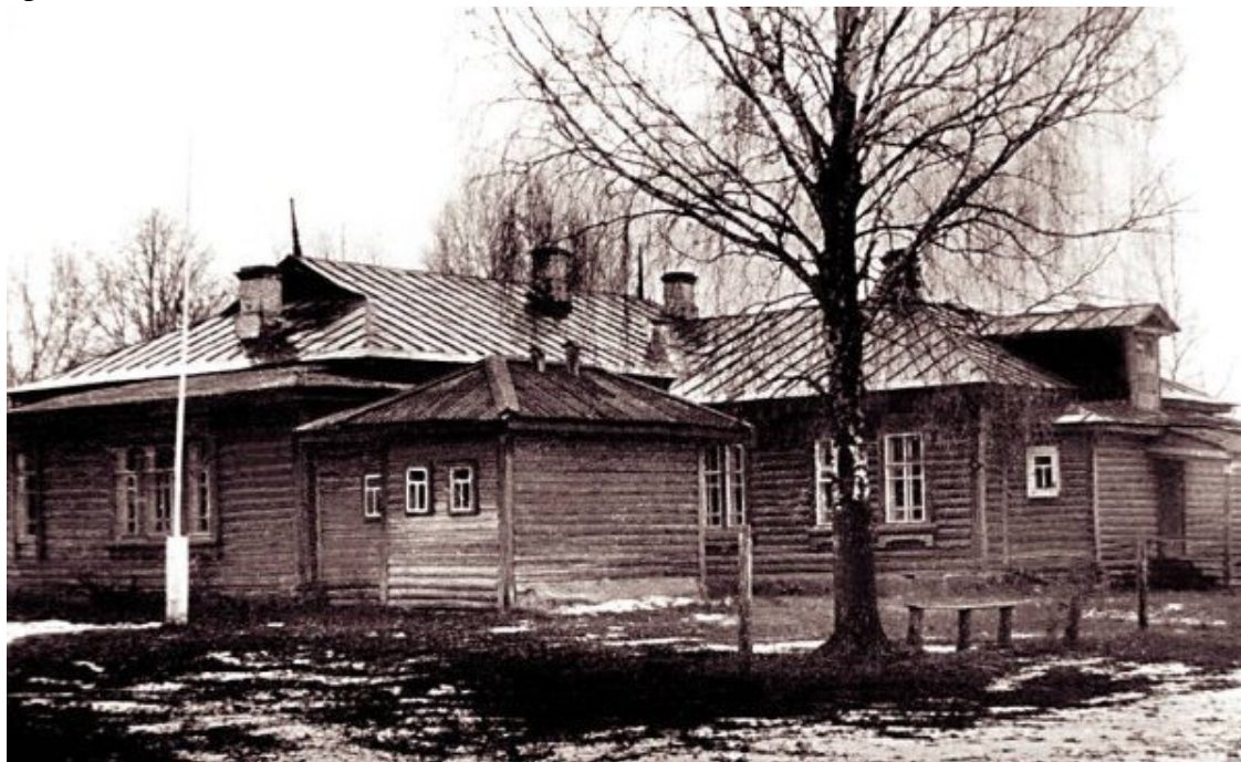
Вольницевская школа, построенная земством в 1912 г. по одному проекту со стреневской школой. Фото 1986 г.