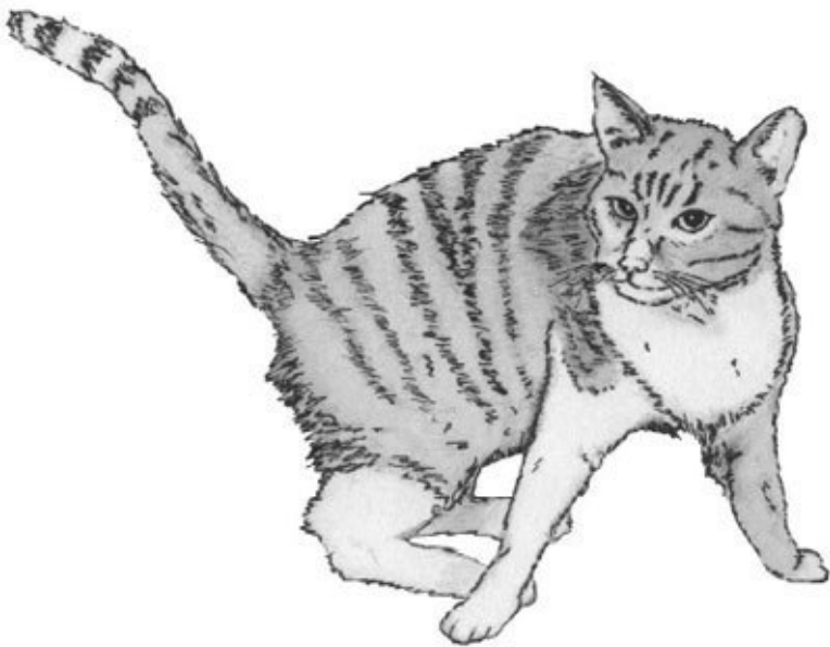
Американская короткошерстная Рисунок Б. С. Наумов

Ноги средней длины, мощные, равномерно сужающиеся книзу.