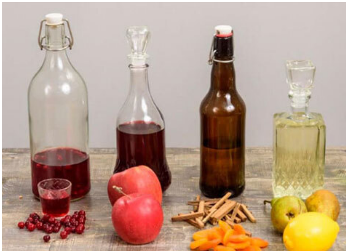
Рис. 5. Самогон, как основа настоек

Подытожим. Выберите сырье, на котором хотите работать. Может быть, это будет водка, купленная в соседнем магазине. Может быть – спирт, приобретенный у проверенного поставщика и разбавленный хорошей питьевой водой. Либо же вы сами сделаете самогон и изготовите настойку “от и до” без покупных ингредиентов. Теперь вам известны плюсы и минусы каждого варианта. А мы переходим к следующему шагу – выбору ингредиентов и оборудования для настаивания.