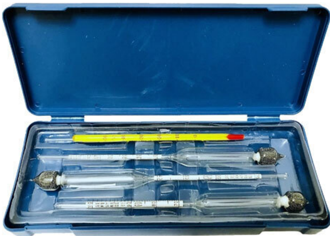
Рис. 7. Набор ареометров АС-3

Набор ареометров (в народе – спиртометров) и мерный цилиндр. Если вы делаете настойки на водке, смело пропускайте эти два пункта: ареометры и мерный цилиндр нужны, чтобы контролировать спиртуозность после разбавления водой, и понадобятся только тем, кто будет настаивать на самогоне или покупном спирте.