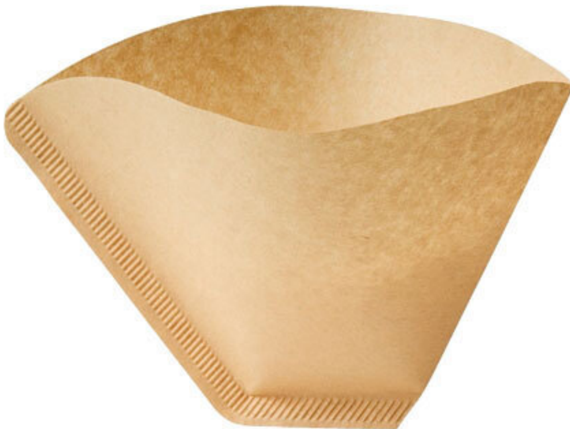
Рис. 10. Фильтровальный пакет для капельных кофемашин

Для подслащивания настоек понадобится декстроза . Я рекомендую приобрести 1 кг в ближайшем магазине самогонварения или в интернет-магазине. Но вы всегда можете заменить декстрозу натуральным медом!