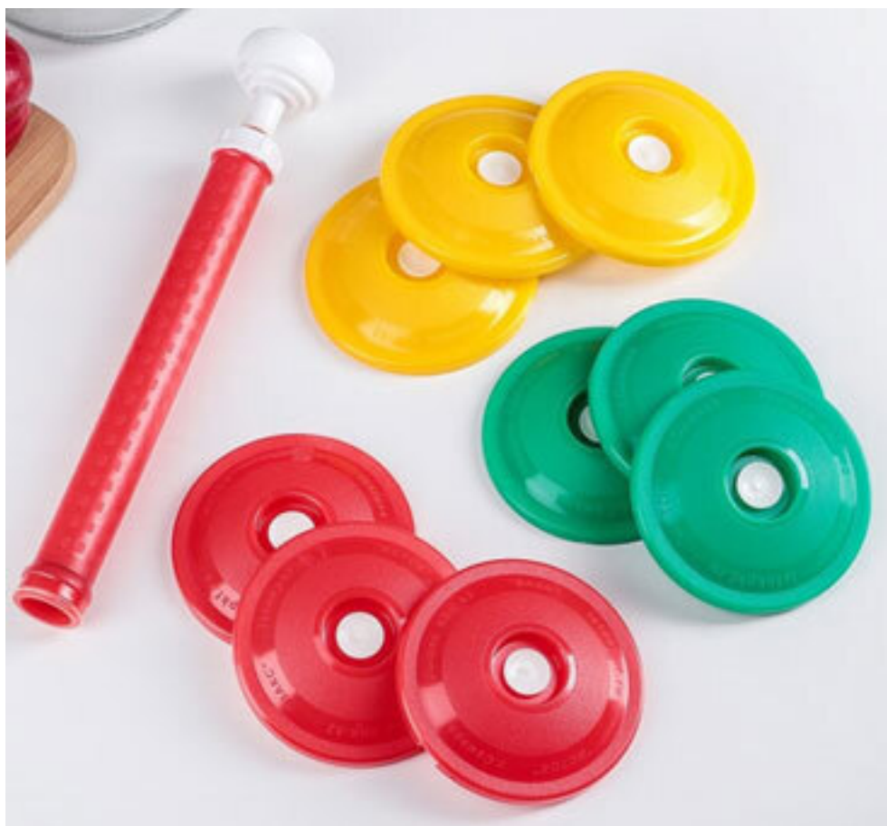
Рис. 11. Набор системы ВАКС

Обратите внимание, что вакуум работает, только если на крышке банки нет неровностей и сколов. Отсортируйте свои банки и выберите те, которые смогут держать вакуум. Остальные можно продолжать использовать с обычными крышками.