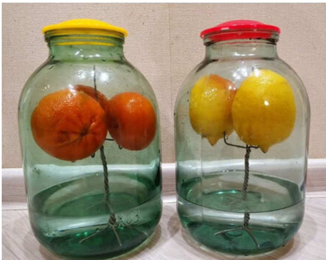
Рис. 2. Настойка по методике «Висельник»

Есть настойки, в которых алкоголь вообще не касается сырья . Например, очень популярна настойка на лимоне “висельник”: лимон висит в банке над водкой, самогоном или разбавленным спиртом и таким образом отдает напитку свой вкус и аромат.