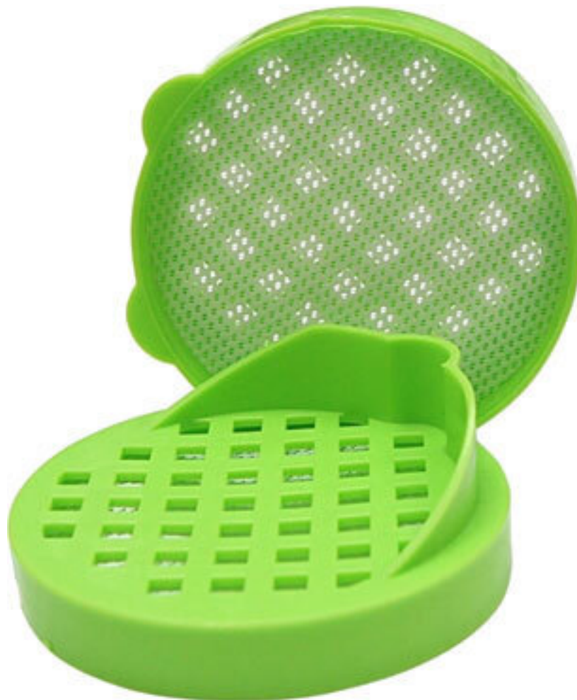
Рис. 9. Крышка-сито для банки на 3 литра

Конечно же мы хотим, чтобы наша настойка получилась красивой и прозрачной. Чтобы полностью очистить напиток от сторонних примесей, я советую использовать фильтровальные пакеты для капельных кофемашин . Вставьте их в воронку и не спеша пропустите напиток. Так вы сможете эффективно отфильтровать даже самую мелкую взвесь, оставшуюся в банке после настаивания.