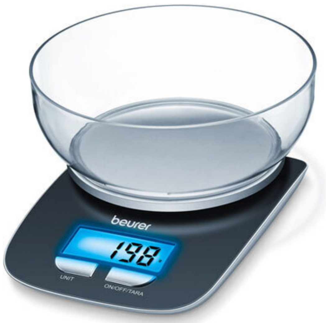
Рис. 8. Электронные весы для взвешивания ингредиентов настоек

Также я рекомендую приобрести электронные кухонные весы , чтобы взвешивать сырье для сложных рецептов. Рецепты пишутся не зря, точное соблюдение пропорций – залог вкусной настойки.