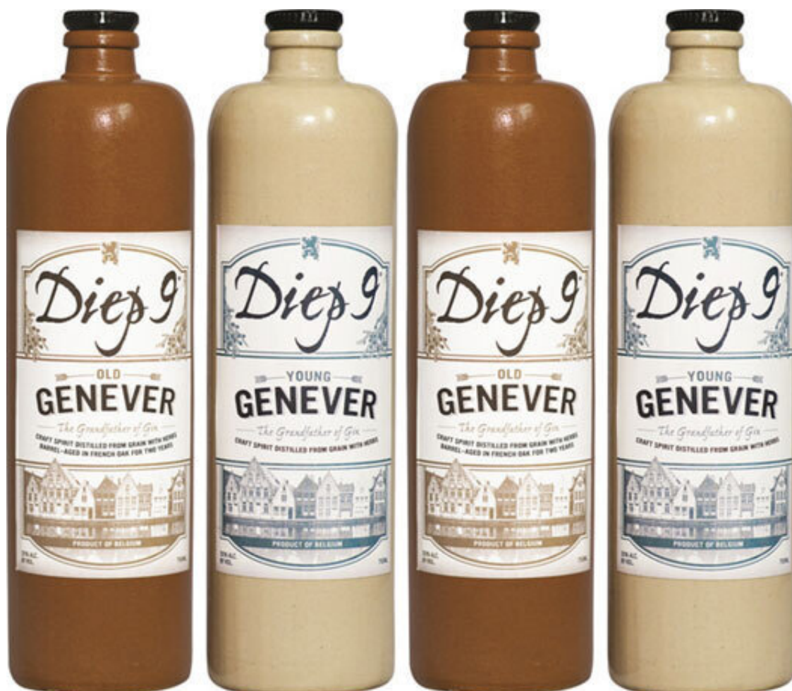
Рис. 1. Жenever – прадедушка Джина

Первые настойки были призваны смягчить дурной вкус некачественного алкоголя. Так, в XVI в. в Европе аптекарь Франциск Сильвиус изготавливал “женевер” – настойку на можжевеловых ягодах, “прадедушку джина”. На Руси же получили распространение перцовка, хреновуха и Ерофеич. Хреновуху пили крестьяне, алкоголь однократной перегонки маскировался в ней терпким ароматом корня хрена. Для людей побогаче предназначался Ерофеич – настойка на травах и кореньях. Поскольку знать могла себе позволить содержать придворных винокуров, те проводили до девяти перегонок и даже на простом оборудовании получали самогон крепостью до 70 %. Пить его в чистом виде было трудно, а разбавлять водой считалось дурным тоном. Поэтому самогон настаивали на сложной смеси трав и специй, получая крепкий пряный напиток.