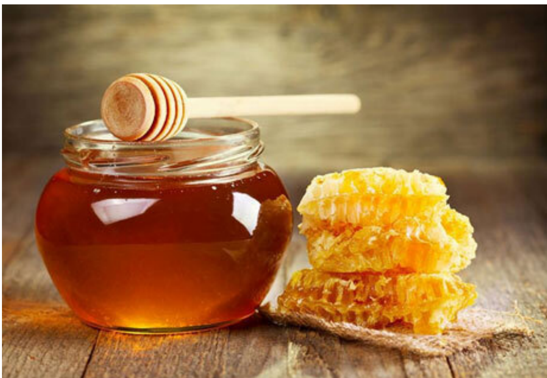
Рис. 13. Натуральный мед входит в состав многих настоек

Третий способ – самый полезный – это мед . Мед дает и вкус, и цвет, но может изменить первоначальный вкус напитка. Однако многим настойкам мед только придает изюминку, к тому же, он прекрасно сочетается с ягодами и орехами.