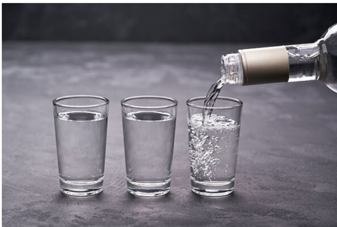
Рис. 4. Водка, как основа настоек

Настойку можно сделать практически на любом алкоголе, и самый простой вариант – купить водку. Но здесь есть несколько подводных камней, о которых я обязан предупредить. Во-первых, надо разобраться, достаточно ли хорошего качества выбранная в магазине водка. Не устану повторять, настойка – не средство маскировки плохого алкоголя! Ни в коем случае не берите самую дешевую водку, иначе вместе с настойкой получите головную боль, агрессию и плохое настроение. Так что если вы решили пойти по простому пути и выбрали водку, обязательно купите ту, которую выбрали бы для употребления в белом виде.