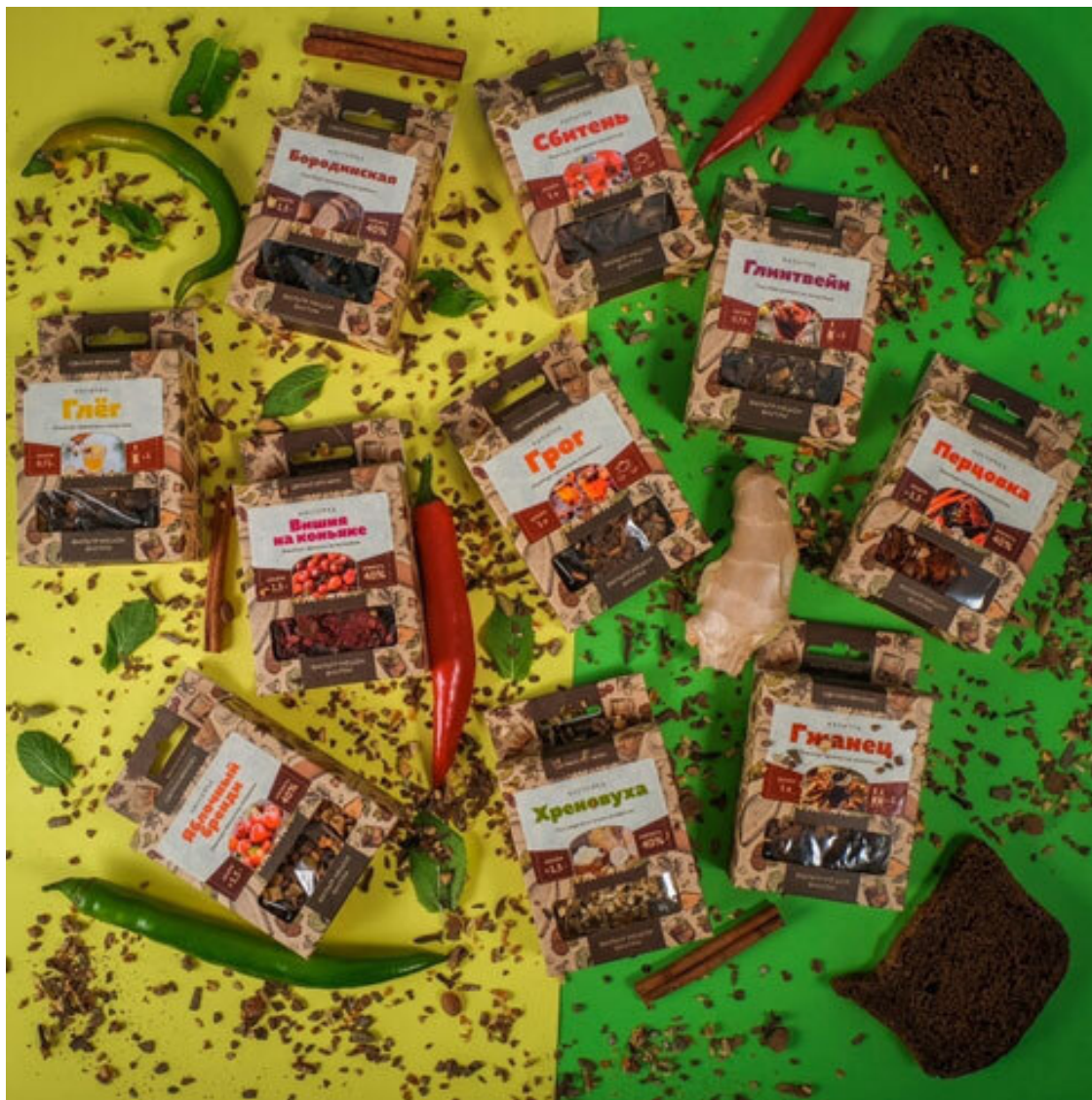
Рис. 6. Готовые наборы для настаивания

Знакомство с миром настоек проще начать с готовых наборов для настаивания. В их составе собраны все необходимые по рецепту травы, корни, пряности, специи и ягоды. Топовые наборы, например, наборы от компании «Алхимия вкуса», содержат все необходимое для производства настойки и подачи ее на стол: подробный перечень ингредиентов, пошаговую инструкцию по настаиванию, мешок для фильтрации и наклейки на бутылки.