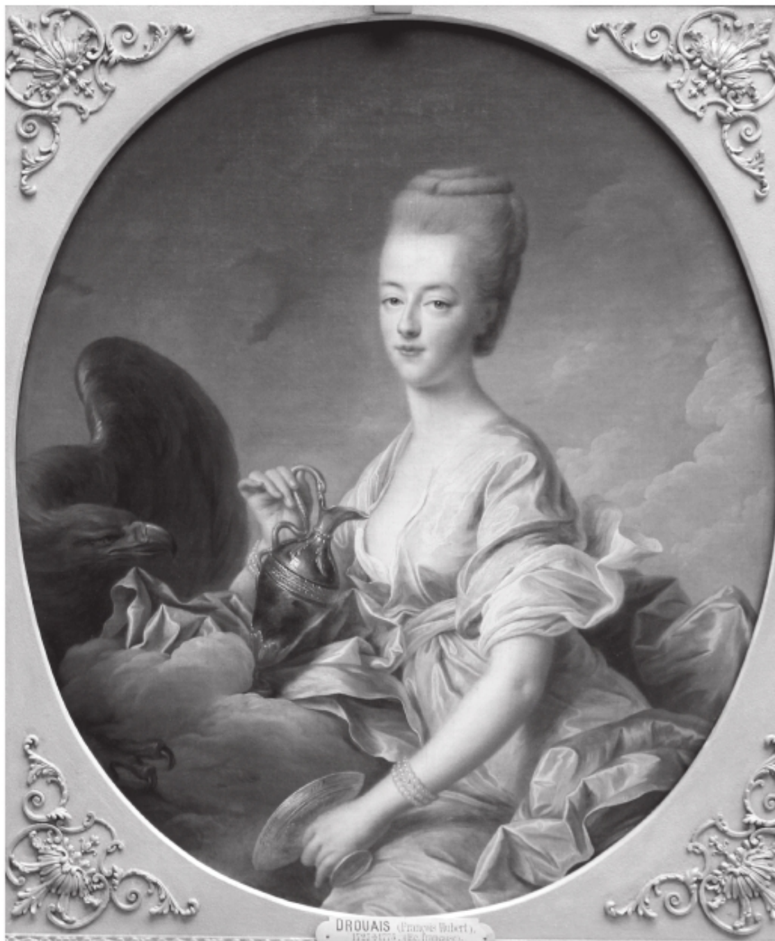
Франсуа-Юбер Друэ. Довина Мария Антуанетта в образе Гебы