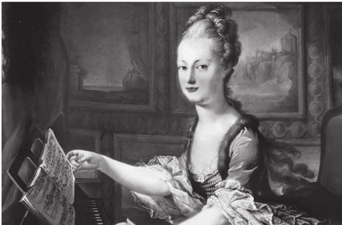
Франсуа-Юбер Друэ. Мария Антуанетта за клавесином

И действительно, премьера «Ифигении» оказывается триумфом, но скорее это триумф Марии Антуанетты, нежели Глюка. Газеты и публика настроены холодно; они находят, что «опера имеет несколько удачных мест наряду с весьма посредственными», — как всегда, в искусстве грандиозная смелость редко понимается заурядной аудиторией с первого раза. Но Мария Антуанетта вытащила на премьеру весь двор; даже ее супруг, который не пожертвовал бы своей охотой и ради музыки сфер, для которого один убитый олень значит куда больше, чем все девять муз, вместе взятые, на этот раз должен быть возле нее. Поскольку нужное настроение устанавливается не сразу, Мария Антуанетта в своей ложе после каждой арии демонстративно аплодирует; из вежливости девери, золовки и весь двор вынуждены прилежно вторить ей, и таким образом вопреки всем интригам этот вечер становится событием в истории музыки. Глюк завоевал Париж, Мария Антуанетта впервые открыто навязала свою волю столице и двору. Это первая победа ее индивидуальности, первая демонстрация силы молодой женщины перед Францией. Еще несколько недель, и титул королевы упрочит власть, которую она уже захватила.