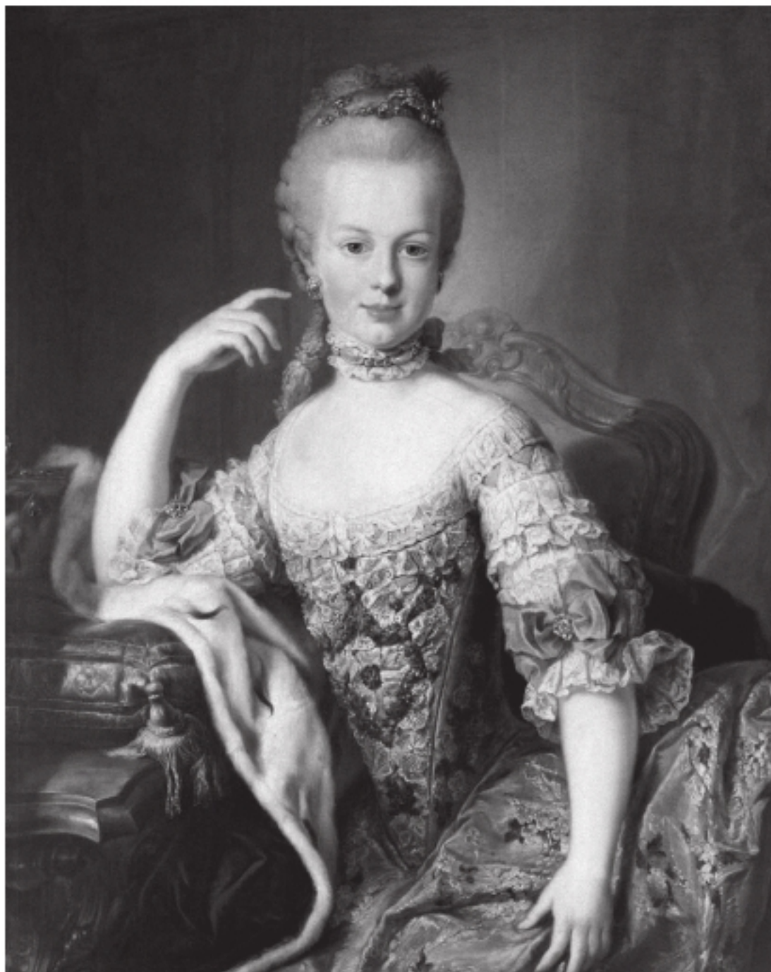
Мартин ван Майтенс. Мария Антуанетта