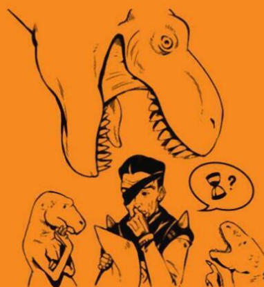
путешествие во времени