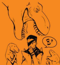
путешествие во времени