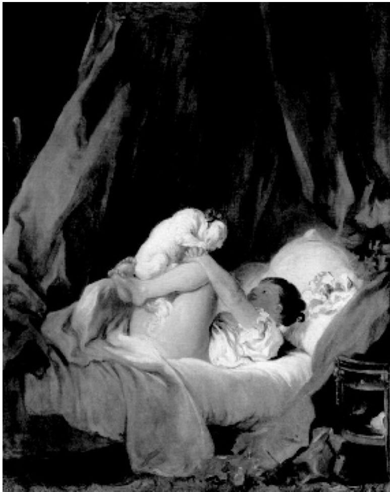
Ж.-О. Фрагонар. Дама с собачкой