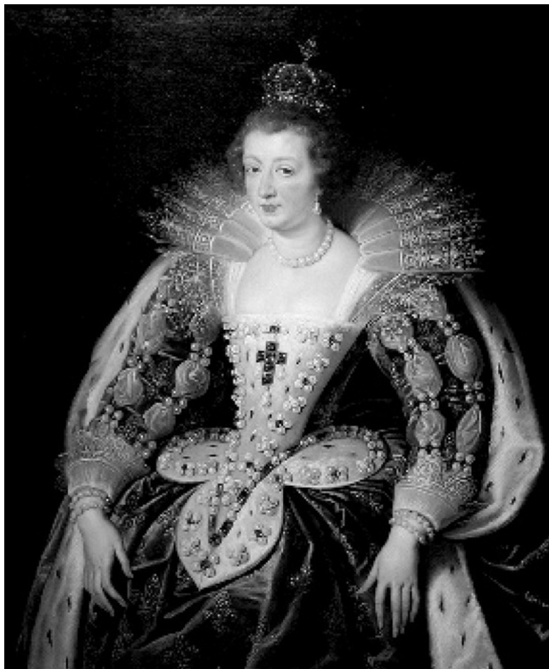
Королева Анна Австрийская