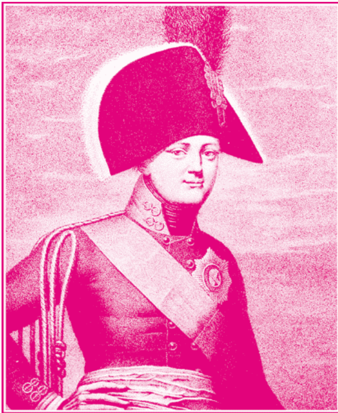
Император Александр I

Царствование. Александр, преемник императора Павла, вступил на престол с более широкой программой и осуществлял ее обдуманнее и последовательнее предшественника. Я указывал на два основных стремления, которые составляли содержание внутренней политики России с начала XIX столетия: это уравнивание сословий перед законом и введение их в совместно дружную государственную деятельность. Это были основные задачи эпохи, но они осложнялись другими стремлениями, которые были необходимой подготовкой к их разреше-