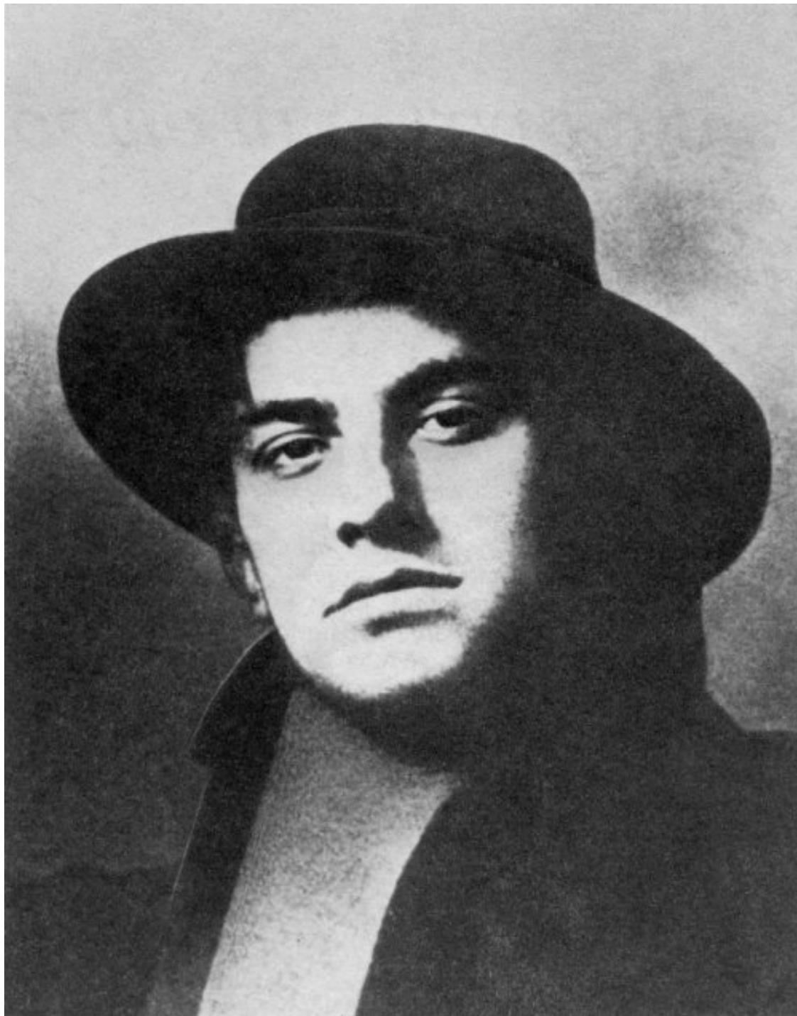
В. Маяковский. 1912 г.

Хотя он говорит без угрызений совести и с гадливостью о пестрошерстой кошке толпы, он сам затесался в нее. Протрезвевшему к утру поэту сделался больней «враждующий букет бульварных проституток», и жутко и отрадно было взглянуть, как гроба домов публичных «восток бросал в одну пылающую вазу» («Утро», 1: 35). Но все те же видения не покидали его и в порту, куда он забрел, шатаясь по городу.