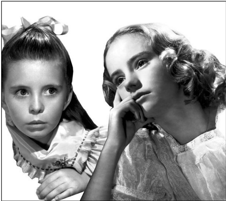
1944 год. Юные звезды Маргарет О'Брайен и Пегги Энн Гарнер