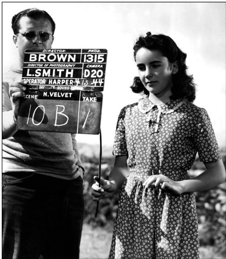
На съемочной площадке