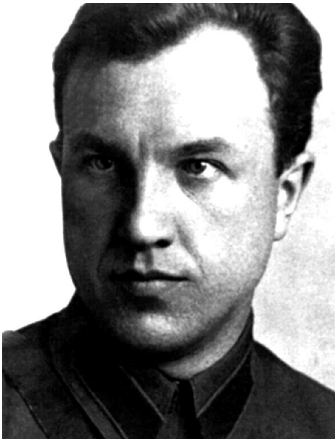
Виктор Абакумов – уполномоченный ЭКО ОГПУ, 1932 г.