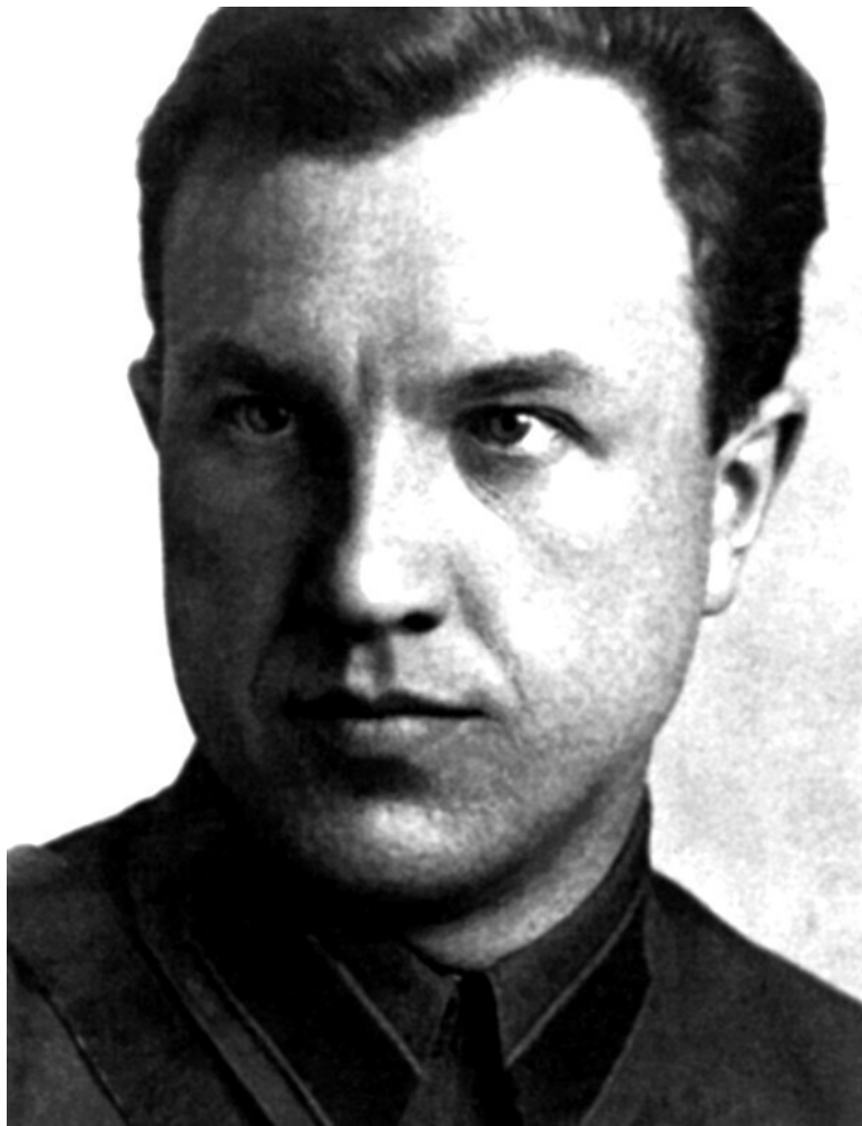
Виктор Абакумов – уполномоченный ЭКО ОГПУ, 1932 г.