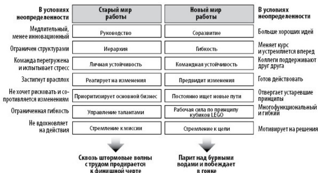
Рис. 1.1. Сравнение старого и нового мира