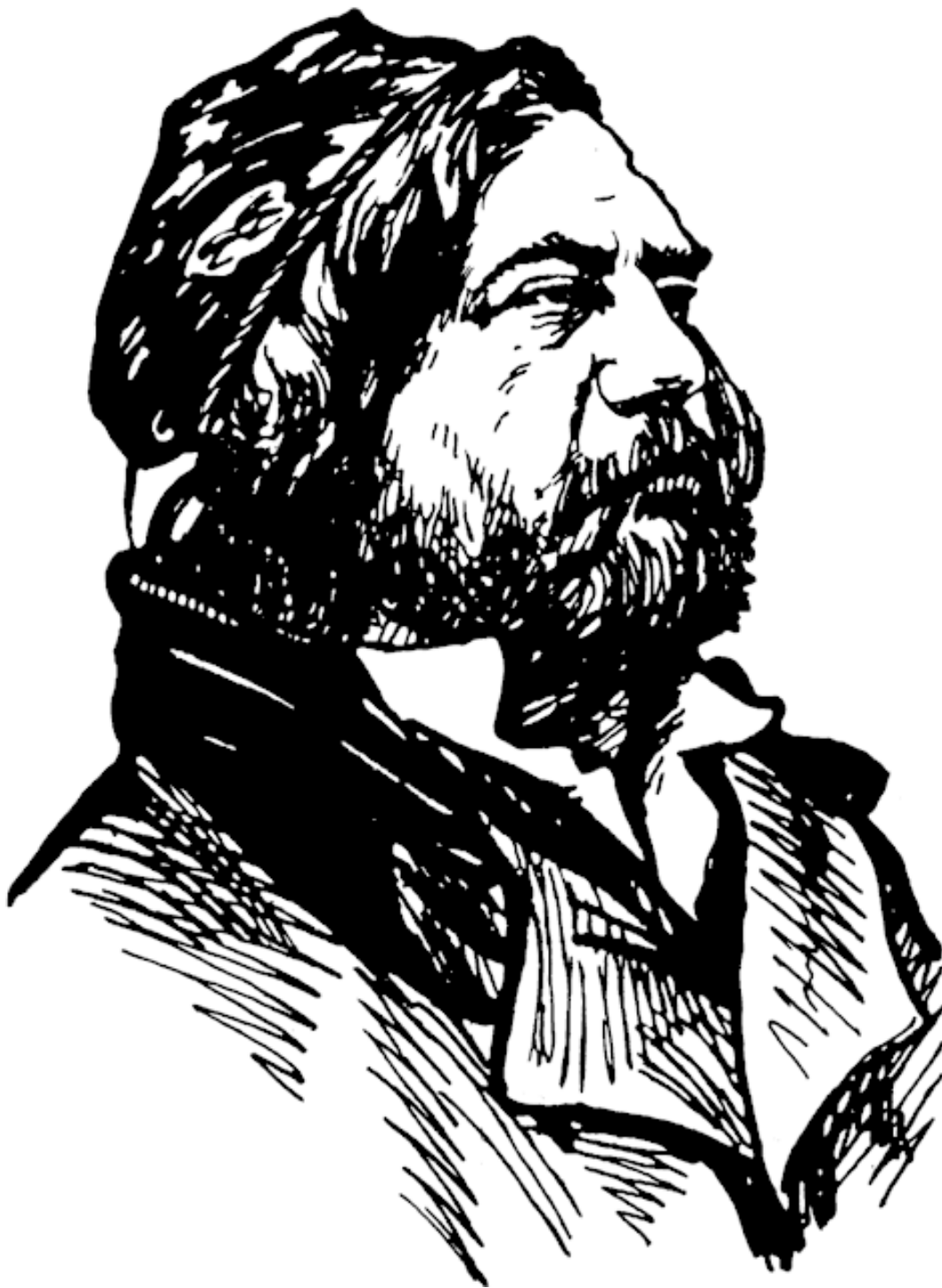
Теофиль Готье. Рисунок И. Кричевского. 1964

На бледности ее янтарной, – Как жгучий перец, как рубец, – Победоносный и коварный Рот – цвета сгубленных сердец.