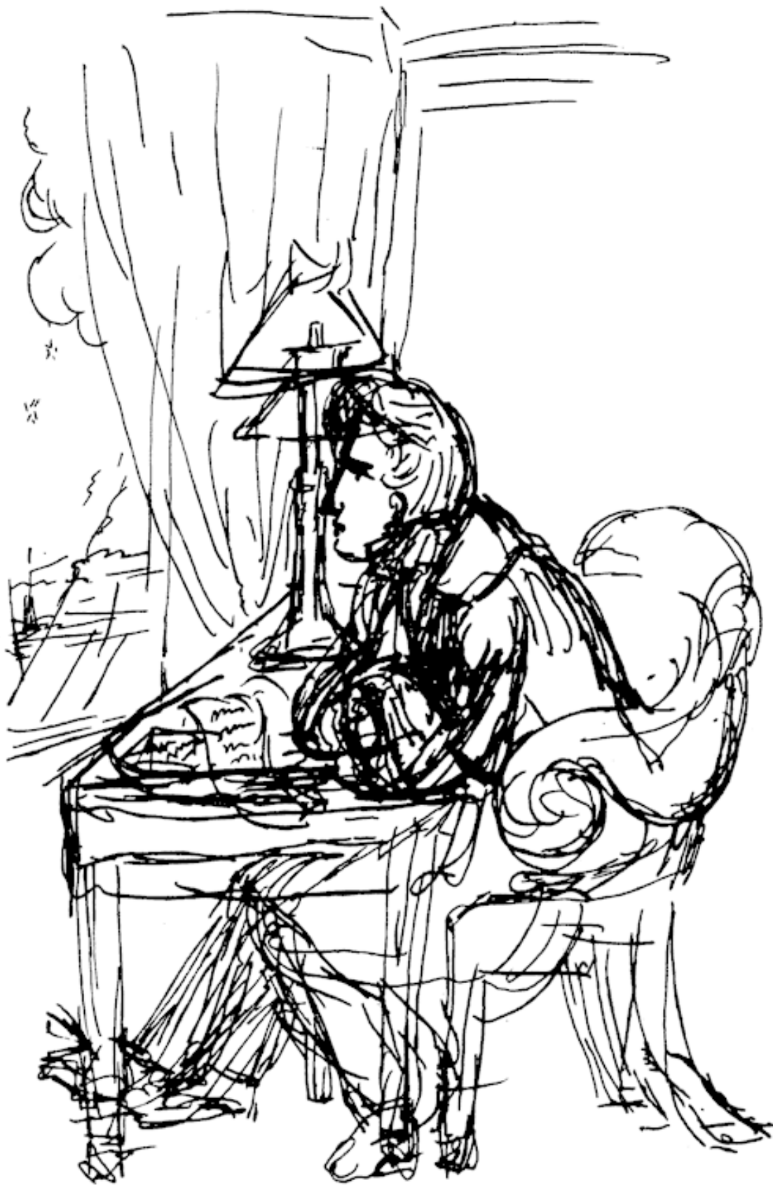
Альфред де Виньи. Автопортрет