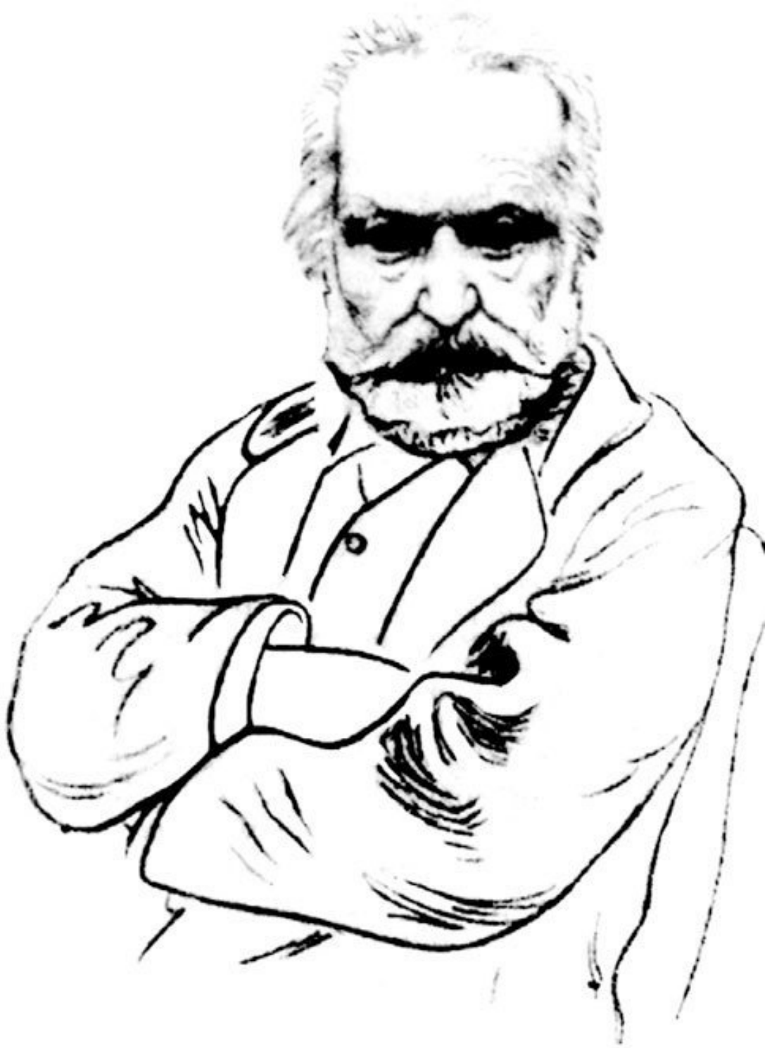
Виктор Гюго. Рисунок Натана Альтмана. 1961