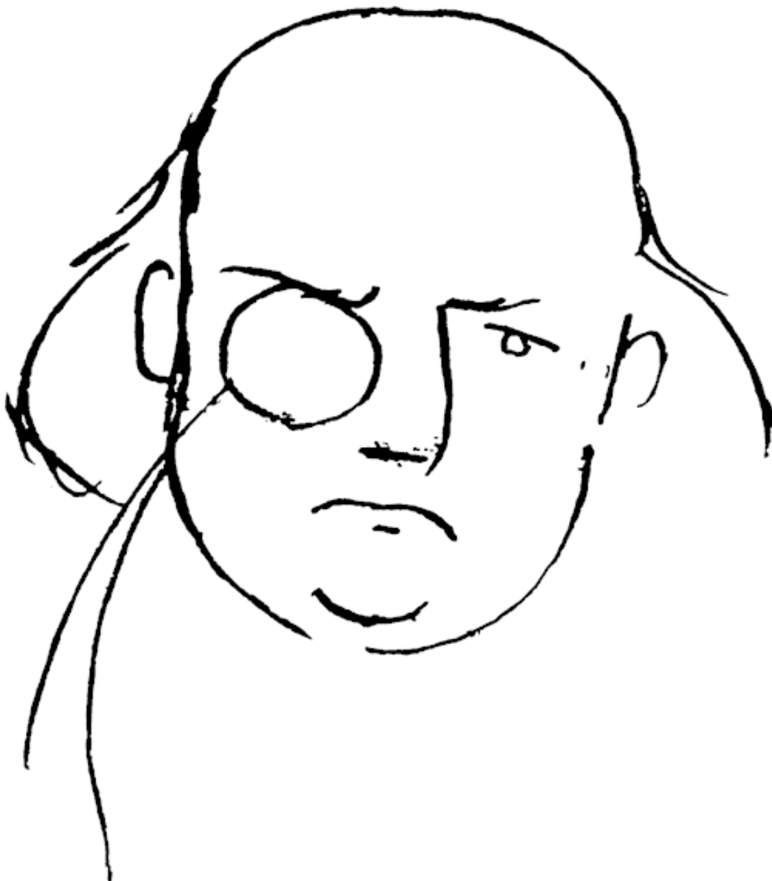
Шарль Леконт де Лиль. Рисунок Поля Верлена

Я не хочу просить твоих свистков и вздохов, Я не пойду плясать в открытый балаган Среди твоих блудниц и буйных скоморохов.