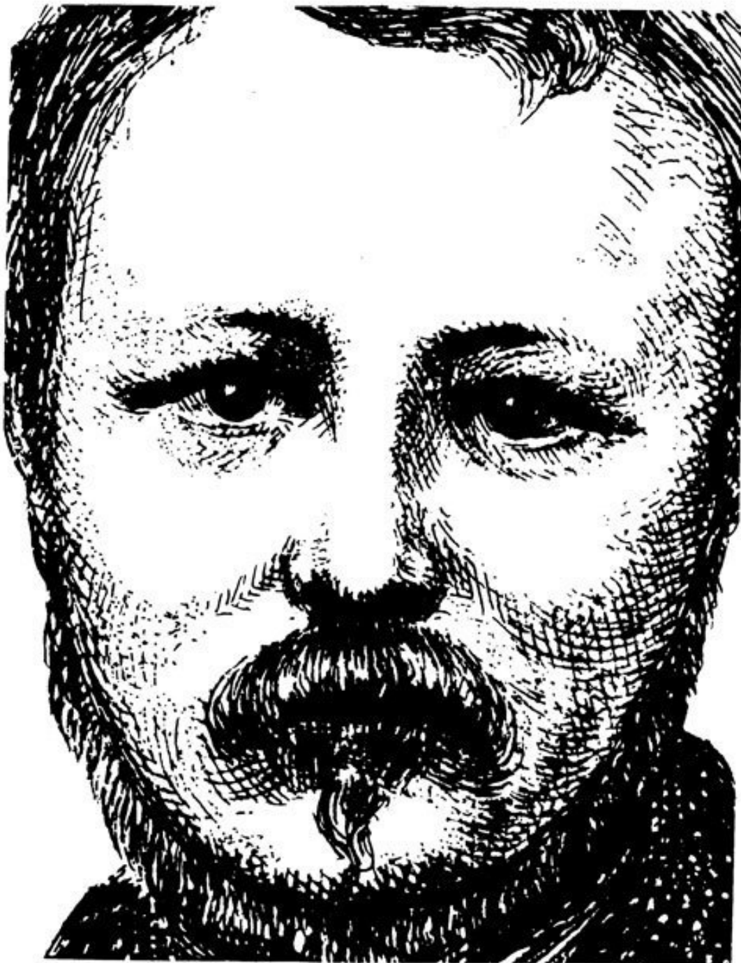
Жерар де Нerval. Гравюра Ж.-А. Анрио. 1878

как «Сильвия» (1853) и «Аурелия» (1855), где рассказ о действительно случившемся спяном сновидении и местными народными поверьями средней Франции.