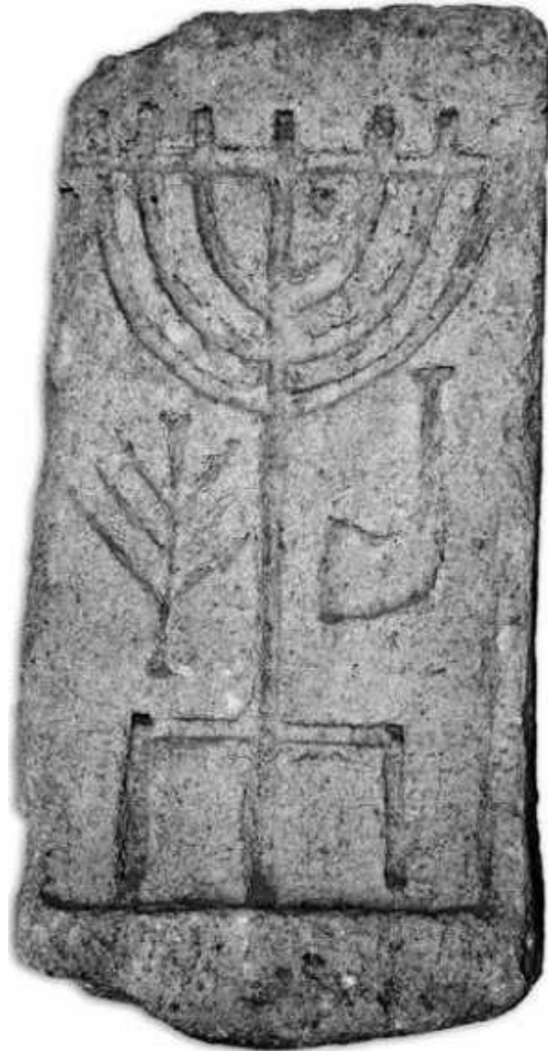
Плита с изображением иудейской символики. Пантикапей. (Керчь), 3–4 вв.

В раннем средневековье на Таманском полуострове, евреи жили в таком количестве, что византийский историк Феофан в 671-м году записал в путевых хрониках следующее: "В городе Фанагория, и в его окрестностях около живущих там евреев проживают и многие другие племена". Улавливаете подтекст? Это как если бы – "а в Суздали, около живущих там русских живут ещё и не русские". Справедливости ради, следует признаться, что обитавшие в греческих колониях северного Причерноморья иудеи не чурались обращения в иудаизм живущих по соседству представителей "многих других племён".