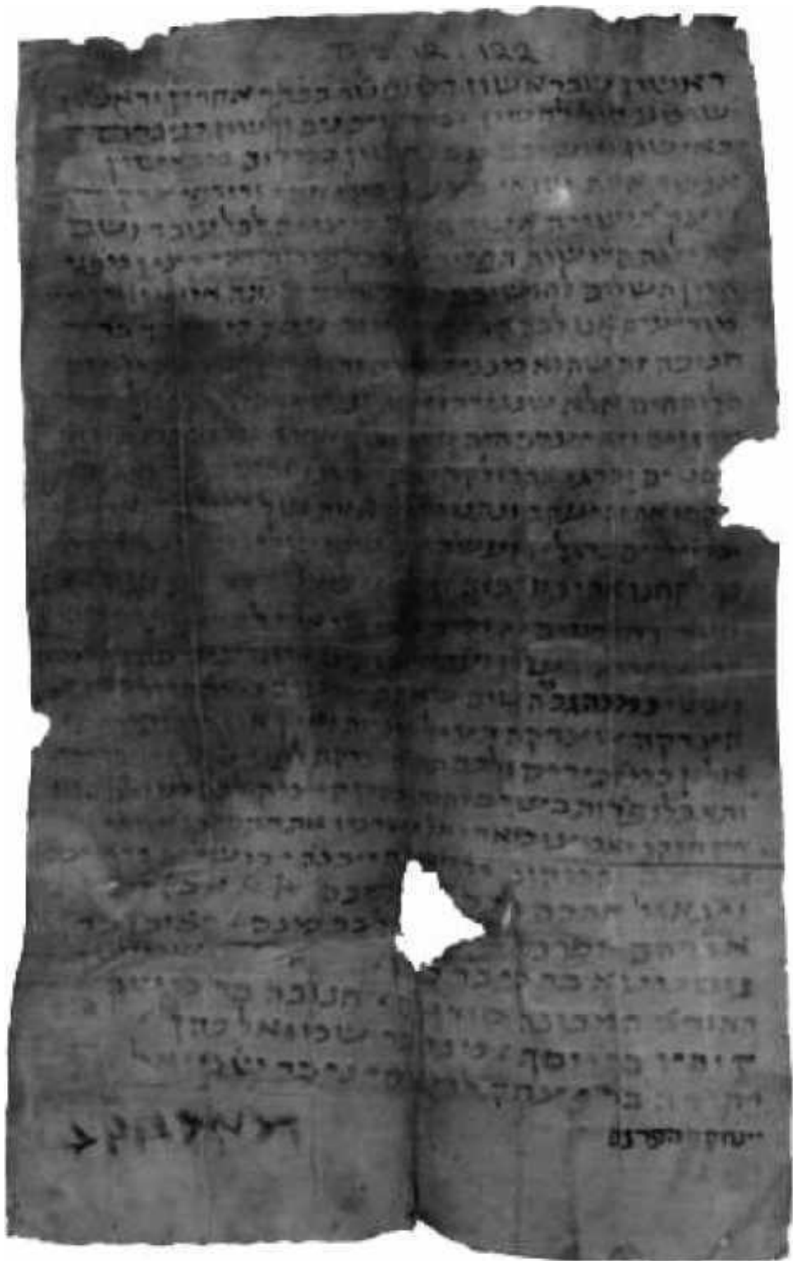
Киевское письмо. Киев, 10 в.