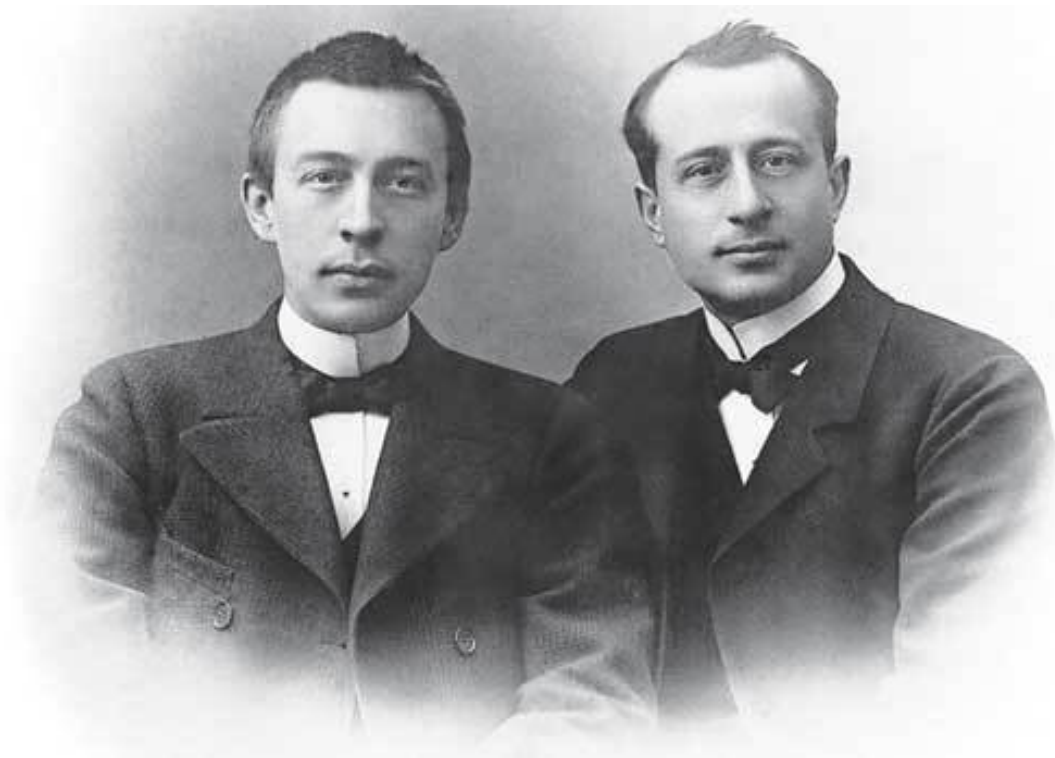
Александр Зилоти и Сергей Рахманинов. 1902 г.