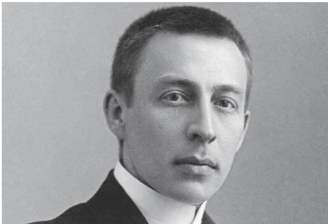
Сергей Рахманинов. Лондон, февраль 1914 г.