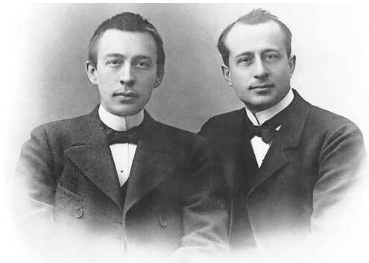
Александр Зилоти и Сергей Рахманинов. 1902 г.

достопочтенного Рубца. Но и здесь Рахманинов продолжал лениться, уверенный в том, что педагоги высоко оценивают его талант, пока вовсе не бросил Петербургскую консерваторию.