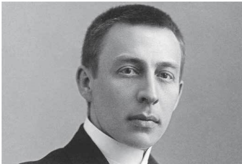
Сергей Рахманинов. Лондон, февраль 1914 г.

в том, что она содержит точный указатель рахманиновских произведений со всеми датами начала работы и ее завершения, обозначенных на всех рукописях композитора. Видимо, в доме Рахманинова побывали представители каких-то советских организаций и нашли рукописи, которые композитор, покидая Россию, бросил в оставленном доме. Их существование сделалось известным публике благодаря вышеупомянутому Беляеву. В брошюре указаны и даты первого исполнения сочинений Рахманинова; это единственный источник, из которого я черпаю сведения для этой книги.