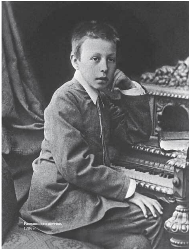
Рахманинов в детстве. 1886 г.