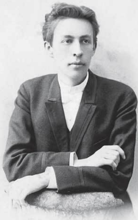
Сергей Рахманинов. 1892 г.