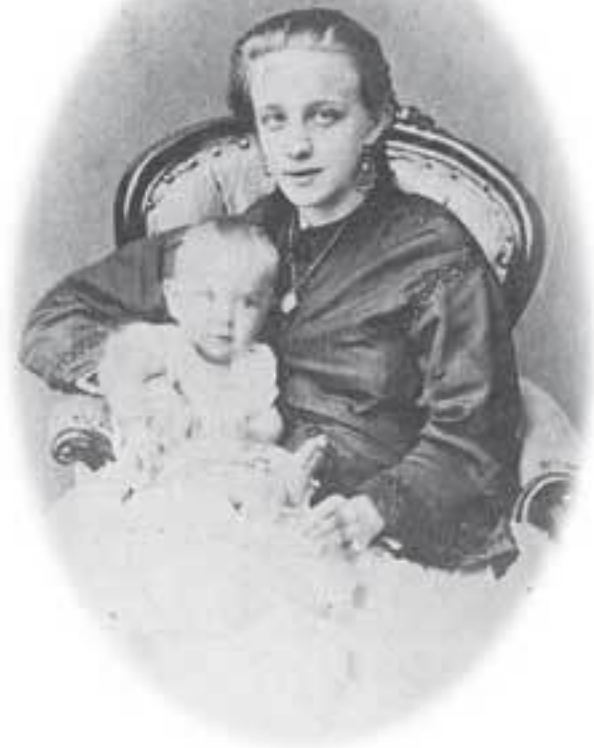
Любовь Петровна Рахманинова с сыном Сергеем

В 1882 году Рахманиновы переехали в Санкт-Петербург. К тому времени конфликт между родителями, назревавший уже очень давно, достиг своего апогея – они расстались. Раз-