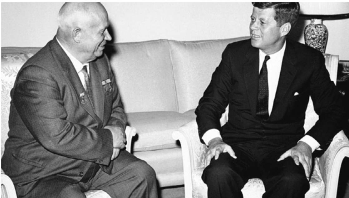
Никита Хрущев и Джон Кеннеди. Попытка найти общий язык

Весной 1962 Москва приняла решение разместить на Кубе дивизию, оснащенную ракетами средней дальности Р-12 и Р-14. К ним прилагалась отдельная эскадрилья бомбардировщиков Ил-26, которые считались надежными носителями ядерных ракет и представляли для американцев особую угрозу как наступательная сила. Для защиты этой группировки на Кубе разместили 144 установки ракет «земля-воздух» и полк истребителей МИГ-21. Кастро получил и оперативно-тактические ядерные снаряды с дальностью полета 60 км, предназначенные на случай вторжения и, конечно, опытных советских солдат и офицеров. Сам Хрущев осознавал, что этот шаг – в значительной степени авантюра. Но он считал её допустимой и даже полезной, чтобы «сбить спесь» с американцев и укрепить социалистический блок.